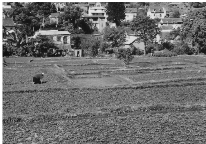
Photo 1. Cressonnières dans le vallon d'Ambanidia, à Antananarivo-ville (centre-ville à 1,5 km).

À Antananarivo, capitale de Madagascar, ville tropicale de montagne, l'habitat s'est traditionnellement concentré sur les collines et les sommets, en laissant les vallons et les zones de plaine à l'agriculture. Aujourd'hui, celle-ci est présente jusqu'au centre-ville (Photos 1 et 2), où elle continue d'occuper les bas-fonds les plus inondables, la plaine environnante, récemment réaménagée hydrauliquement, et les collines périurbaines : elle représente 43 % des quelque 425 km 2 de l'agglomération (Rahamefy et al. , 2005). Cependant, elle reste très méconnue et n'est