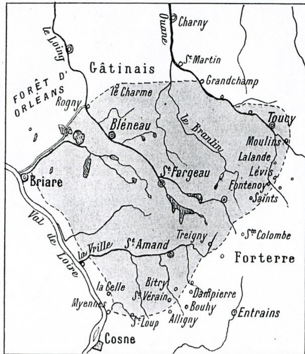
FIG. 2. — Les limites populaires de la Puisaye.