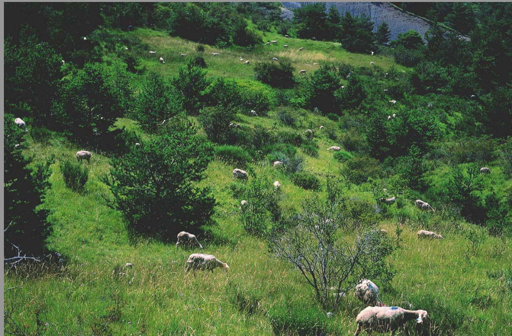
Collines de la Drôme