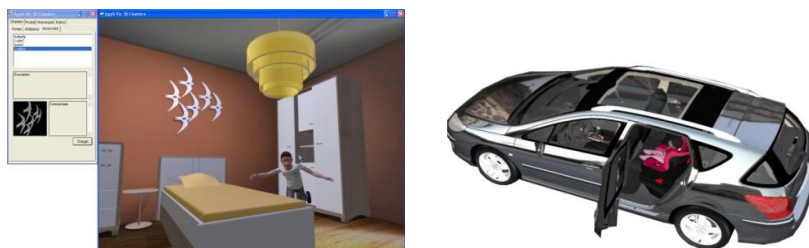
Figure 3. Environnement chambre (a) et voiture (b)

Le projet Appli-Viz'3D est un outil collaboratif d'aide à la décision en conception. Il permet la mise en situation de prototypes et d'avatars dans des environnements virtuels 3D réalistes. Il a pour objectif de permettre aux concepteurs d'un produit de mettre en scène et d'évaluer rapidement des concepts. C'est ainsi un outil d'aide à la décision qui permet une visualisation 3D d'éléments en cours de création. Ce logiciel permet également aux commerciaux des entreprises de présenter des concepts de produits de manière interactive (Figure 3) dans leurs environnements d'utilisation (chambre d'enfant et un habitacle de voiture). L'artefact conçu concerne ici donc le logiciel d'aide au choix de concept de produits de puériculture (par ex., un meuble, un siège auto). Les utilisateurs finaux de ce logiciel sont une population d'utilisateurs professionnels (designers, marketeurs, ingénieurs).