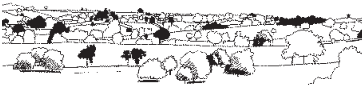
Village, élevage et paysages complexes ? Dessin de Claire Brenot.