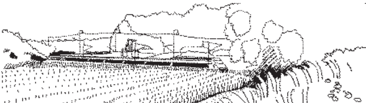
Train express régional ou train à grande vitesse ? Dessin de Claire Brenot.