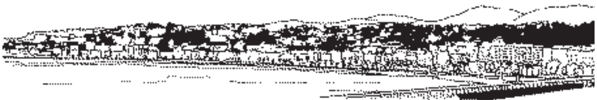
Le littoral méditerranéen, une « ville linéaire » en devenir ? Dessin de Claire Brenot.