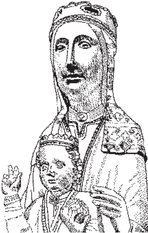
La Moreneta, la Vierge noire de Montserrat, pourrait-elle faire pleuvoir ? Dessin de Claire Brenot.

delà, des communautés autonomes d'Andalousie et de Castille-La Manche. Résultat des opérations : une cacophonie politico-hydrologique et un coûteux approvisionnement depuis Marseille par bateau. Retour sur images.