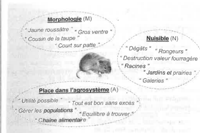
FIGURE 3 : Citations utilisées par les éleveurs pour définir le campagnol terrestre lors des entretiens.

En 2011, les modifications du système d'élevage décrites par les éleveurs se déclinent autour de 3 axes : la conduite des parcelles , la conduite du troupeau et la gestion des stocks . Certains éleveurs ont modifié la conduite des prairies infestées, en augmentant la fréquence de passage des herbes pour détruire les tumuli (4/19), en ressemant soit par sursemis, soit après retournement des prairies (3/19). Quand les ressources en herbe ont été insuffisantes, certains éleveurs ont complété leurs animaux avec des fourrages provenant de leur stock (3/19) et un éleveur a dû retarder la mise à l'herbe des animaux en raison de parcelles trop dégradées. Les éleveurs ont acheté des fourrages (3/19) mais aussi vendu les animaux (broutards, génisses, vaches) plus tôt dans l'année (3/19). Trois ans après la pullulation et une certaine prise de recul, certains éleveurs (4/19) déclarent avoir modifié leur « logique » vis-à-vis des stocks fourragers et du type d'animal vendu. Ainsi, plutôt que d'engraisser les vaches de réforme, broutards repoussés ou génisses, les éleveurs ont privilégié la conservation des stocks fourragers pour le troupeau reproducteur.