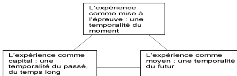
Figure 3. Les trois temporalités de l'expérience