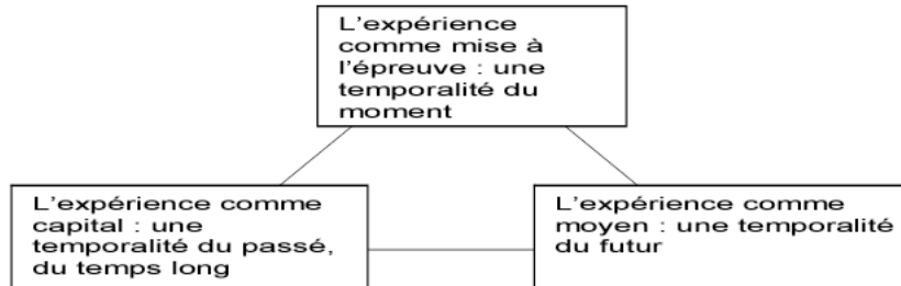
Figure 3. Les trois temporalités de l'expérience