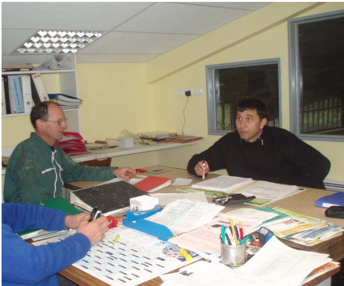
Situation d'entretien

J'ai été conscient dès le départ de mes deux rôles complémentaires : en effet, je devais conduire l'entretien pour l'équipe et en même temps relever ce qui était la réponse à la question sur les ressentis vis-à-vis de la démarche, que je devais plus particulièrement analyser avec un chercheur. Pour garder une trace des entretiens et pour pouvoir revenir au matériau d'origine, je les ai enregistrés.