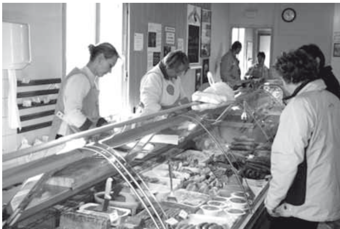
Un étal d'agriculteurs vendeurs de viande en vente directe.

Le développement de la vente directe en viande bovine a pris de l'ampleur suite aux crises successives de la filière : « vache folle » en 1996 et 2000, fièvre aphteuse en 2001. Des entretiens réalisés auprès d'éleveurs naisseurs engraisseurs spécialisés en production de viande bovine (régions Auvergne, Bourgogne et Limousin) montrent que ce mode de commercialisation a eu des effets sur les résultats économiques des exploitations.