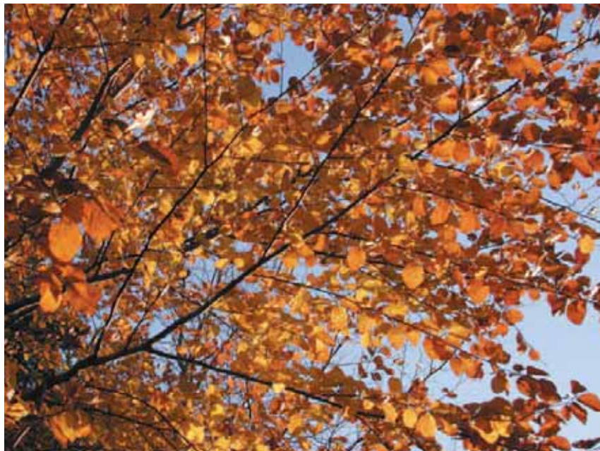
Un hêtre (sain) en habits d'automne

■ Même si les modèles climatiques ne cessent d'évoluer, des incertitudes considérables existent concernant les scénarios d'émissions de gaz à effet de serre à l'échelle du prochain siècle : ils dépendent en effet d'hypothèses sur le développement