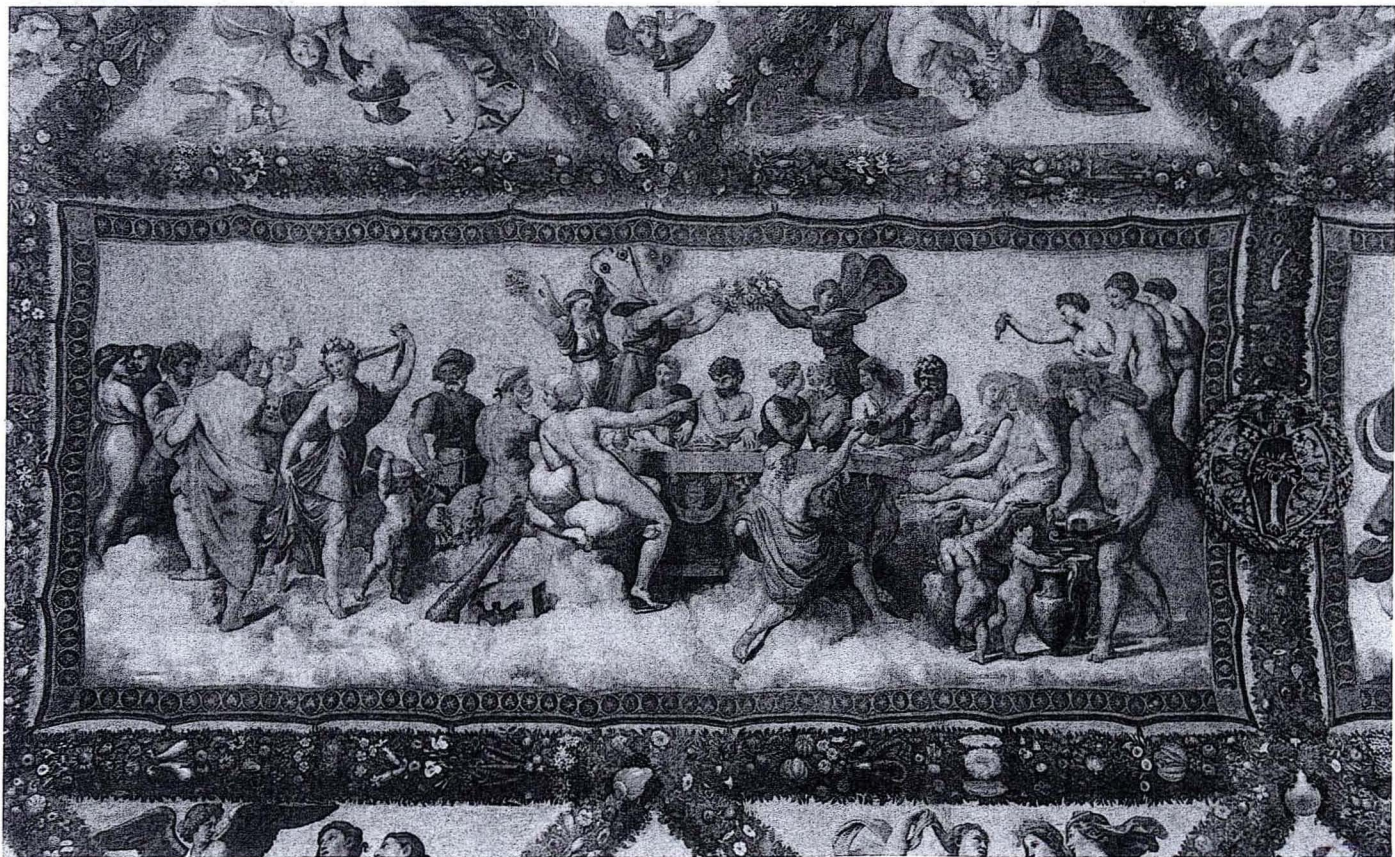
Raphaël, Le Banquet des dieux , Villa Farnésine, Loge de Psyché.