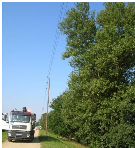
Fig. 4 Rhône canal levee, woody landside face Digue de canal du Rhône, parement aval boisé.

La digue s'élève plus ou moins progressivement (0 à 12 m de hauteur) de l'amont vers l'aval du canal et possède un profil large et régulier (largeur de 6 à 8 m en crête et supérieure à 60 m à la base), avec des pentes de talus de l'ordre de 1V/3H. Le corps de digue est essentiellement constitué de matériaux sablo-graveleux d'origine alluviale avec des passées sablo-limoneuses par endroits. Le parement amont est recouvert d'un masque imperméable en argile et chaux et dispose d'un perré bétonné de protection contre le batillage. Sur le talus aval, une couche de sol organique s'est développée en surface, sur les 30 premiers centimètres. La digue est dotée d'un dispositif d'auscultation complet en piézométrie (un profil en travers instrumenté tous les 250 m), et de quelques stations pour le suivi des débits de fuite ou de drainage.