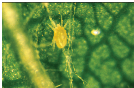
Fig. 2.119. Tydeidae forme estivale