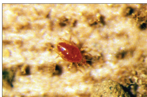
Fig. 2.118. Cunaxidae