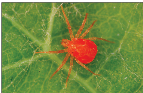
Fig. 2.116. Anystis sp.