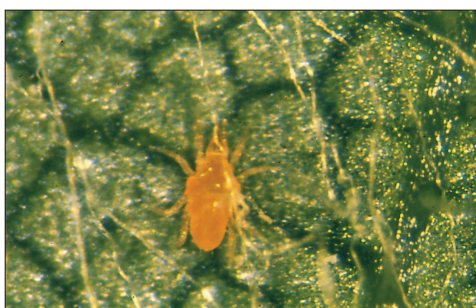
Fig. 2.117. Bdellidae