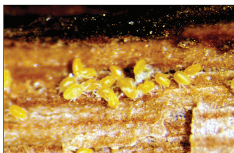
Fig. 2.120. Tydeidae, formes hivernantes