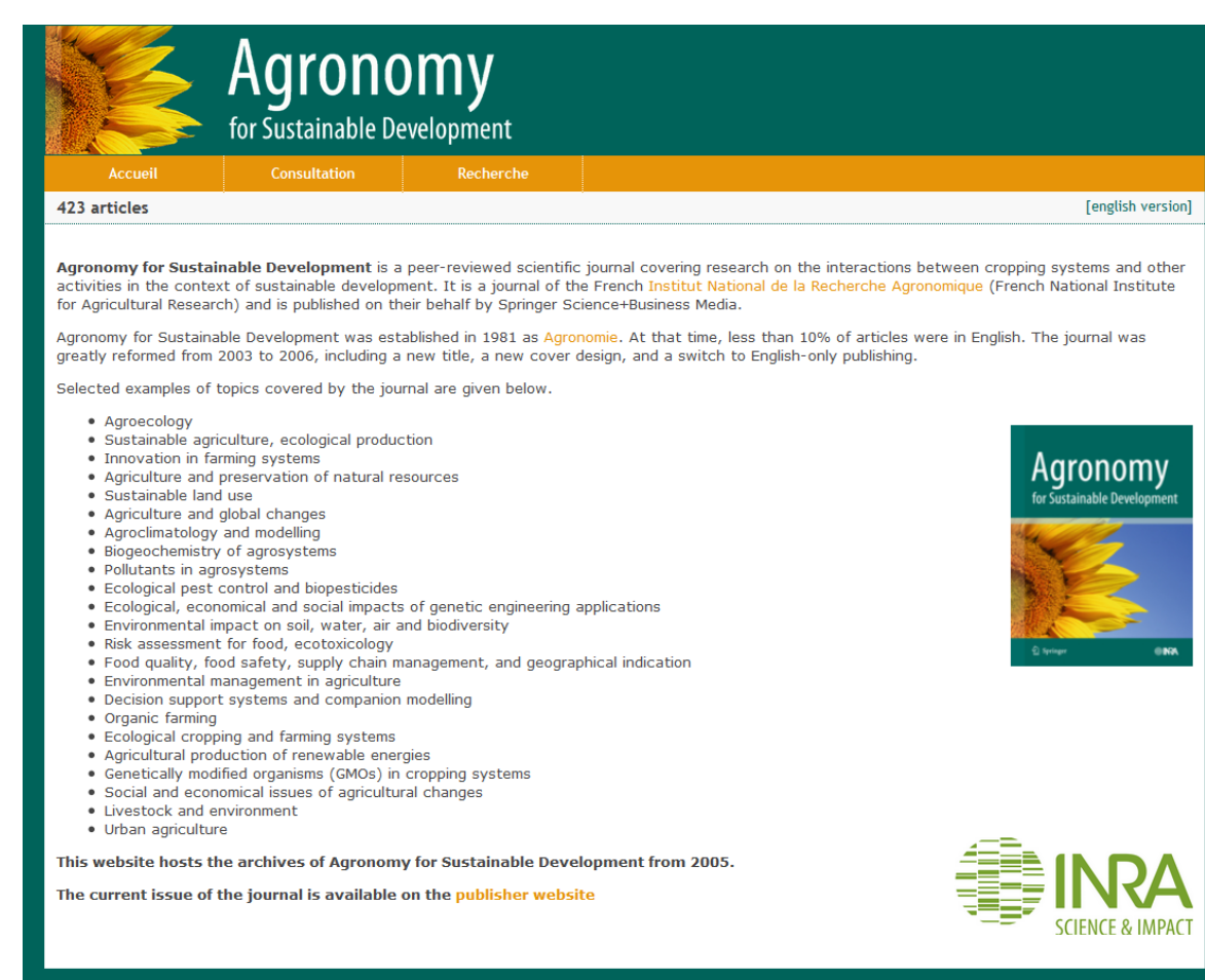
Exemples de collections HAL pour deux revues Inra