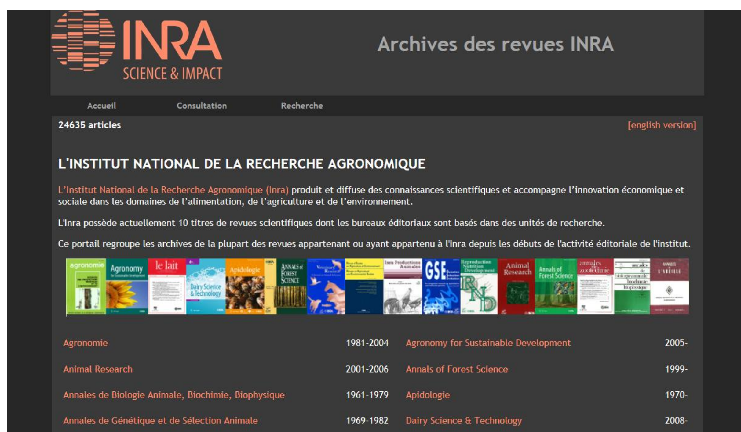
Portail commun des revues Inra sur HAL