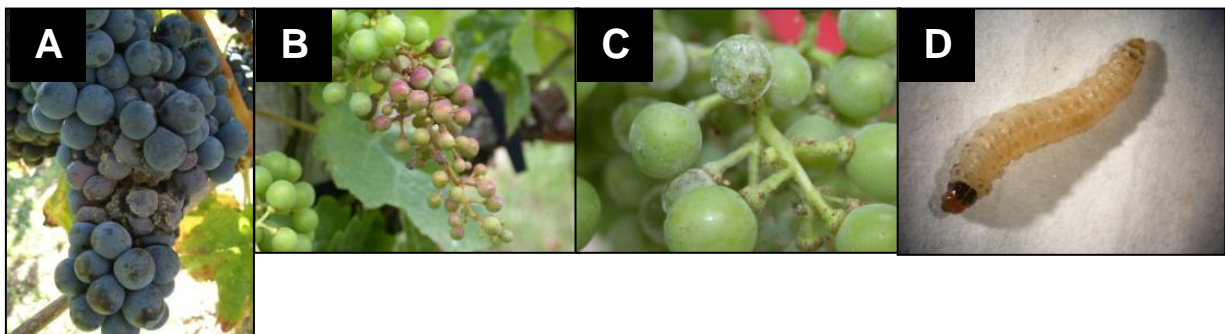
Figure 1 : A : Pourriture grise ( Botrytis cinerea ) ; B : Mildiou, faciès « Rot-brun » ( Plasmopara viticola ) ; C : Oïdium ( Erysiphe necator ) ; D : Cochylys de la vigne ( Eupoecilia ambiguella ), une des Tordeuses de la grappe.

Nous nous sommes concentrés sur les dégâts sur grappes dont la perte quantitative est évaluable suite aux principaux problèmes phytosanitaires communs aux deux régions : le mildiou de la vigne, l'oïdium de la vigne, la pourriture grise et les tordeuses de la grappe (Figure 1 et encadré 1).