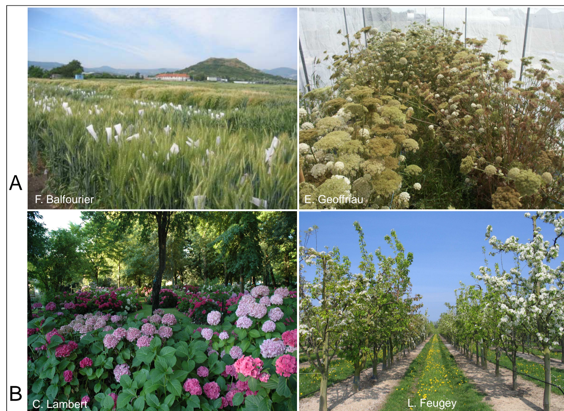
Fig. 3 Maintien de ressources génétiques par (A) régénération de semences de blé (espèce autogame) et carotte (espèce allogame; isolement en cages), (B) plantations d'hydrangea et pommier (espèces pérennes et à multiplication végétative)

Les objectifs des réseaux sont de (fig. 2 & 3) :