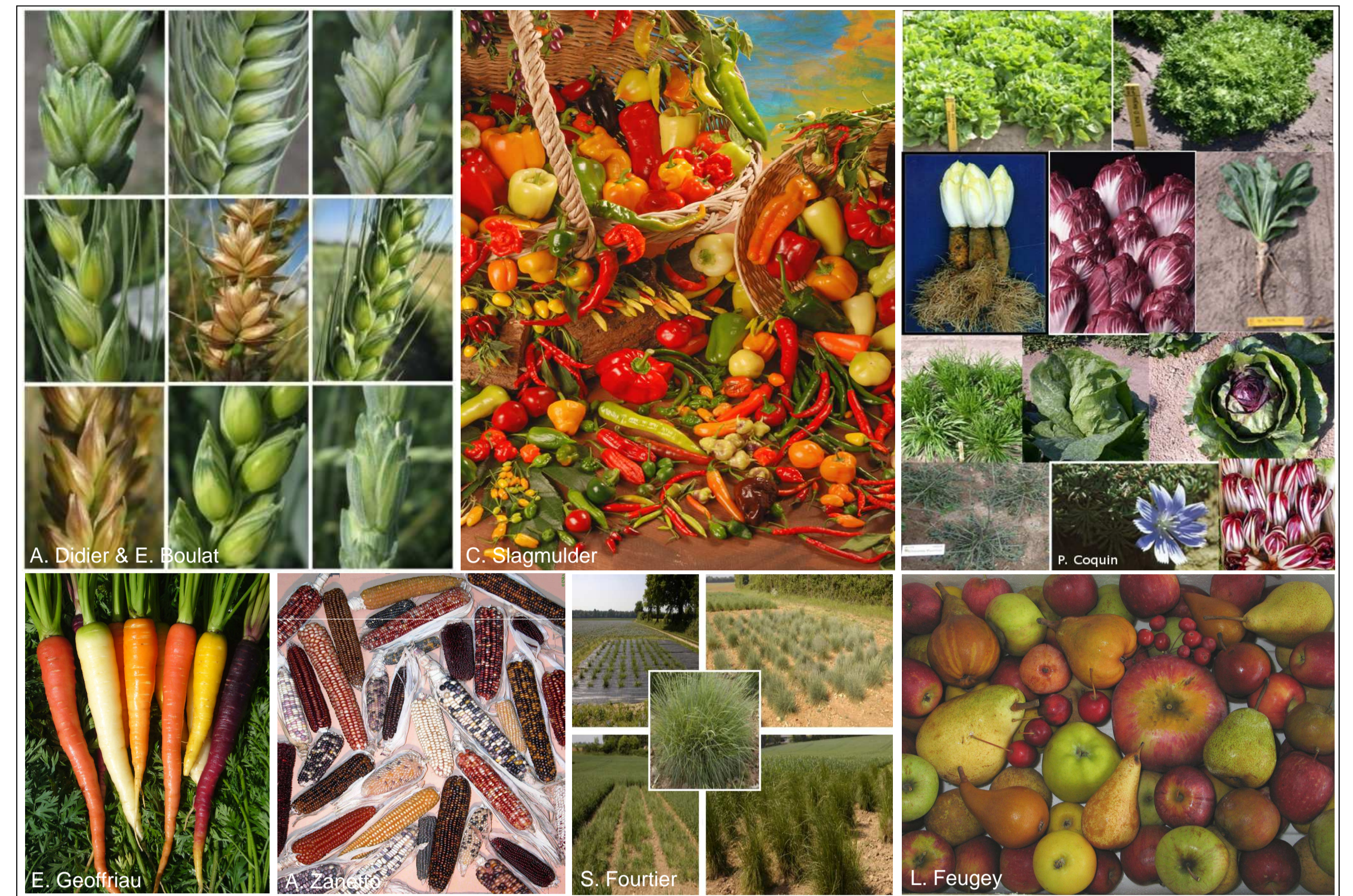
Fig. 1 Exemples de diversité génétique disponible chez le blé, le piment, les chicorées, la carotte, le maïs, les graminées et la pomme/poire

Les ressources génétiques d'espèces végétales cultivées (fig.1) représentent un enjeu important pour l'agriculture à plusieurs niveaux : liens entre agriculture et société, conception de systèmes de culture innovants et diversifiés, innovation produit pour les filières, sélection et création de variétés adaptées, recherche.