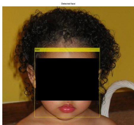
Fig. 6 Detección de rostro

Una vez tomada la imagen (por ejemplo Figura 5), el algoritmo debe tener la capacidad de poder detectar los ojos. Para este proceso, lo que se hace es una detección en cascada. El primer paso es la detección del rostro del niño (Figura 6).