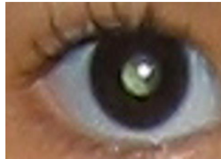
Fig. 9 Detección del ojo individualmente

Para la detección de rostro, se utiliza la función “vision.CascadeObjectDetector” de Matlab. Esta función está implementada utilizando los algoritmos de Viola-Jones [4]. El modelo para la detección de rostro está basado en un análisis de árboles de clasificación y regresión (CART) [5].