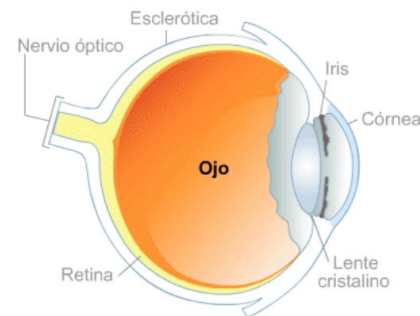
Fig. 4 Anatomía del ojo [Enciclopedia Médica MedlinePlus, 2014]

Como se indica en [10] el retinoblastoma es un cáncer infantil que produce la formación anormal de células malignas, también llamadas cancerosas, en el tejido de la retina.