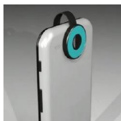
Fig. 3 Peek Retina [Peek Retina acerca los exámenes oculares a tu teléfono móvil, 2014]

El Portable Eye Examination Kit (Peek) es una herramienta que se instala encima del lente del teléfono móvil para obtener un oftalmoscopio portátil de bajo costo [3]