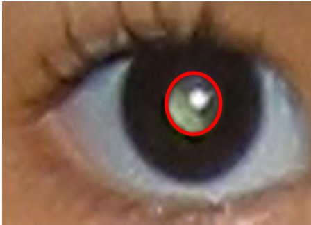
Fig. 9 Análisis del iris del ojo

RightEyeDetector = vision.CascadeObjectDetector('ClassificationModel', 'RightEye');