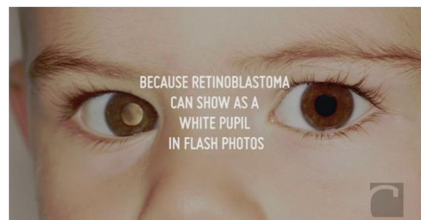
Fig. 1 Advertising Campaign Childhood Eye Cancer Trust [El Comercio Perú, Diciembre 2014, p.12.]

Los posters distribuidos en diversos lugares del Reino Unido contenían imágenes de niños que sobrevivieron a este cáncer gracias a la detección temprana. Estos anuncios se imprimieron con un tipo de tinta especial que al tomar una foto con flash se podía observar como la retina del ojo del niño se tornaba de color blanco.