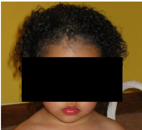
Fig. 5 Ejemplo de fotografía (evitando mostrar la identidad de la niña)

Para poder realizar una detección del retinoblastoma, como se vio en la Sección II, la idea es poder tomar una fotografía de los ojos del niño. Esta fotografía debe ser tomada utilizando el flash de la cámara. Justamente el efecto del flash, es lo que ayudara con la detección.