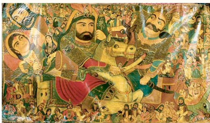
3) Ta'zieh, bataille de Kerbala. Peinture sur toile vernie. Début du XXe siècle