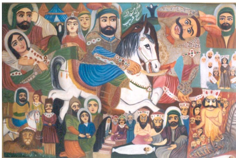
4) Le désastre de Kerbala. Peinture à l'huile. (date inconnue)