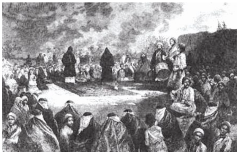
2) Scène de ta'zieh à l'époque Qajare