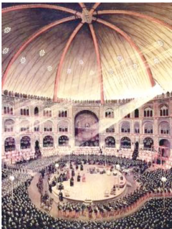
1) Tekieh Dowlat, tableau de Kamâl-ol- Molk, 1880