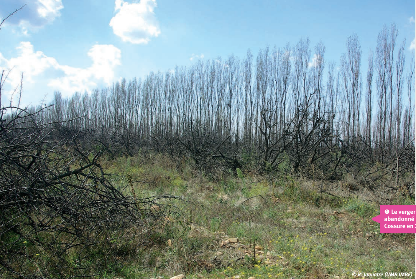
❶ Le verger abandonné de Cossure en 2009.