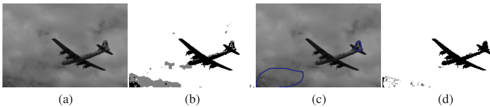
FIG. 2 – (a) image originale, (b) partition crédale obtenue avec SECM, (c) contraintes sur \omega_1 et \omega_2 , (d) partition crédale obtenue avec SECM. Les zones blanches (resp. noires) des partitions représentent \omega_1 (resp. \omega_2 ) et les zones grises \Omega .

Application à la segmentation d'image : L'intérêt de SECM est maintenant illustré avec un exemple de segmentation d'image, ici un avion (cf. Figure 2(a)). Le but est d'isoler l'avion du reste de l'image. Dans une première expérience, nous avons utilisé ECM avec une distance de Mahalanobis. Nous avons considéré qu'il n'existe pas d'objet atypique, donc nous avons fixé \delta^2 à une forte valeur. De plus, nous avons choisi de réduire l'incertitude trouvée par la partition finale en fixant \alpha à une valeur élevée. Ainsi, ECM avec c = 2 , \alpha = 3 et \delta^2 = 1000 trouve la partition crédale dure représentée par la figure 2(b). Nous pouvons remarquer que ECM ne permet pas d'isoler correctement l'avion. Dans une seconde expérience, nous introduisons des contraintes sur la partition comme illustré Figure 2(c). Chaque pixel de la première (respectivement seconde) zone est affectée à \omega_1 (respectivement \omega_2 ). L'algorithme SECM est alors exécuté avec les mêmes paramètres que ECM. La partition crédale résultante est présentée Figure 2(d). Nous pouvons constater que les contraintes ont permis de lever l'indétermination de la plupart des pixels alloués à \Omega .