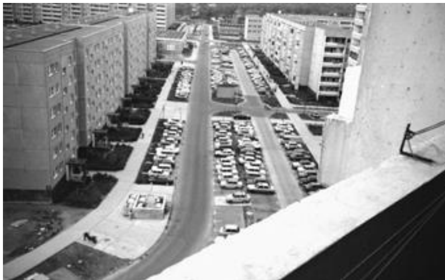
Vue depuis le balcon de Greta Dahlewitz extraite de son album personnel, 3 mai 1991

Par Cécile Cuny Lab'Urba / Institut Français d'Urbanisme / Université Paris-Est-Marne-la-Vallée