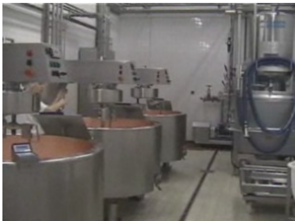
Photo n°1 : L'atelier de production de fromages à pâte pressée cuite.

Quelques aménagements ont cependant été prévus. Le volume à traiter chaque jour étant limité, les concepteurs ont fait le choix de le traiter dans 4 petites cuves (400 litres environ), ce qui permet à quatre apprenants de conduire des fabrications en parallèle (voir photo n°1).