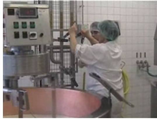
Photo n°2 et 3 : Prise en charge d'une part de l'action de L par le formateur : monstration d'une prise d'information durant le décaillage (découpage du caillé) (à g.) ; monstration des opérations de lancement du chauffage (à d.).

Dans ces deux séances, les interventions du formateur concernent, pour l'essentiel, l'exécution de l'action (part qui se réduit entre les 2 séances) et son contrôle (voir photos n°2 et 3). Il y a peu d'occasions de prise de distance avec l'action conduite par L 8 . A trois reprises le formateur sollicite L pour qu'il explicite son action. Mais il se contente de réponses très limitées quant aux raisonnements à tenir et aux conséquences en terme d'action (l'exemple ci-dessous concerne la fabrication des ferments pour la fabrication) :