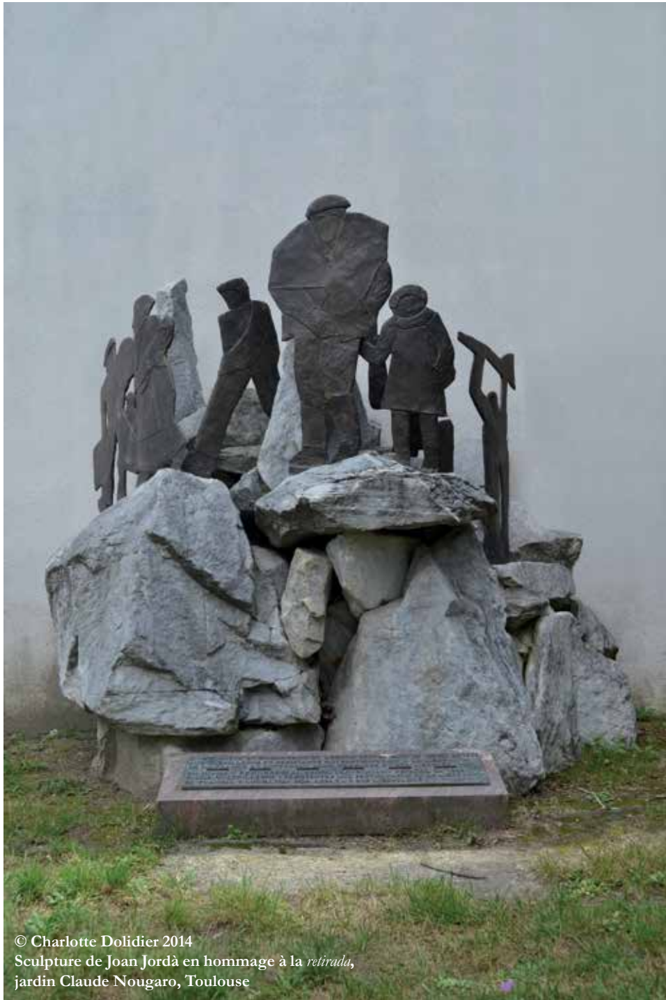
© Charlotte Dolidier 2014 Sculpture de Joan Jordà en hommage à la retirada , jardin Claude Nougaro, Toulouse