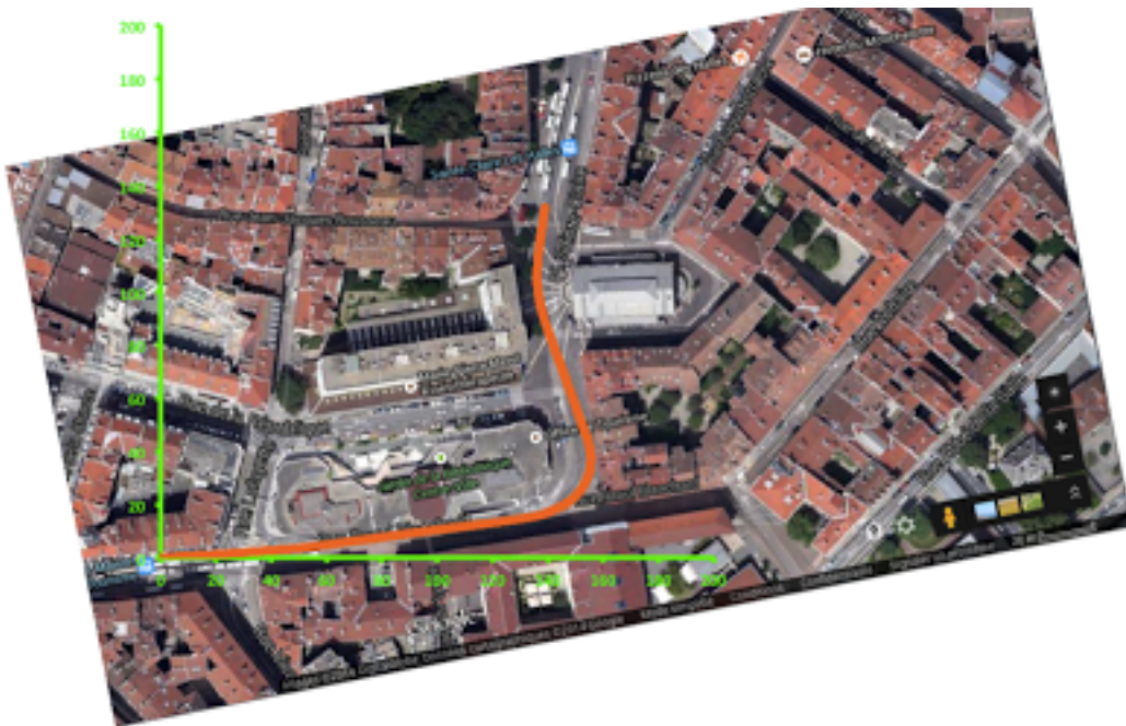
Figure 1 : En orange la trajectoire du Tram B au centre ville de Grenoble déterminée à partir des données des smartphones. On décrit bien le contournement de la Maison du Tourisme suivi d'un léger virage devant la halle Sainte Claire. L'image sur laquelle on pose le résultat du calcul est tirée de Google Maps. Les détails de l'expérience font l'objet d'une présentation sur Youtube à destination des étudiants.

Par exemple, à partir des équations de la Mécanique Classique (le 4 ème cours le plus visité sur le site MIT OpenCourseWare), la combinaison des données issues de l'accéléromètre et du gyroscope du smartphone permet de reconstruire sans paramètre ajustable la trajectoire du Tram B de Grenoble et de la comparer à celle qui apparaît sur Google Maps. Longue discussion avec les étudiants de première année de Licence à propos de l'intégration numérique et des sources d'erreur pour expliquer les différences observées même si le résultat est plus que convaincant. Gros succès aussi auprès des utilisateurs du tramway devant une troupe d'étudiants installant des smartphones sur les sièges et attendant très attentifs les signes du départ.