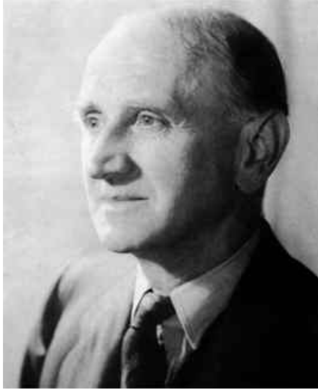
FIGURE 2 – Alec Aitken

particulière, Bernoulli fait correspondre une suite récurrente linéaire. En utilisant une écriture moderne, si l'équation est 1 = a_1x + \dots + a_px^p , la suite associée est u_{n+p} = a_1u_{n+p-1} + \dots + a_pu_n ( n \geq 0 ) 4 . Avec de bonnes hypothèses, le rapport \frac{u_n}{u_{n+1}} tend vers la solution de plus petit module de l'équation. Une analyse de cette méthode est donnée dans [Chabert J.-L. and, 1994], pages 254-259. Les auteurs indiquent que Leonhard Euler dans [Euler L., 1748] donne une preuve de la méthode de Bernoulli en considérant une fraction rationnelle de dénominateur 1 - a_1x - \dots - a_px^p qu'il développe en série entière de deux façons. Tout d'abord, il fait remarquer que les coefficients du développement suivent la relation de récurrence 5 . Puis il obtient le développement en décomposant la fraction rationnelle en éléments simples en faisant donc apparaître les racines de l'équation. Euler d'écrit d'ailleurs le cas d'une équation à racines simples : l'élément simple \frac{1}{1 - pz} se développe sous la forme \sum_{k \geq 0} p^k z^k , ce qui permet d'avoir la règle de Bernoulli 6 . On retrouve toute cette démarche exposée dans [Henrici P., 1988], pages 584-588.