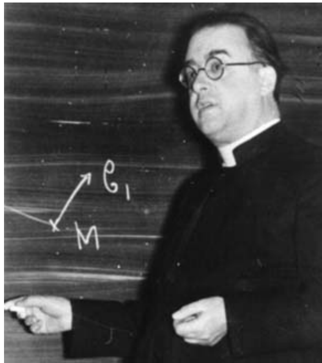
FIGURE 1 – Georges Lemaître