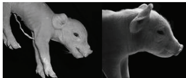
Figure 1 : Profils de porcelets immature (a) et mature (b)

Les porcelets matures présentent des traits semblables à ceux des porcelets plus âgés. De face, leur front et leur museau s'inscrivent dans un grand triangle. De profil, ils possèdent une inclinaison beaucoup plus légère du front (Figure 1.b).