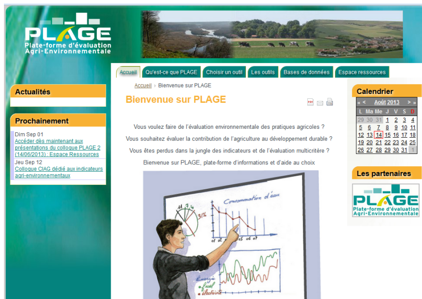
Figure 1 : plage-evaluation.fr , plate-forme d'information et d'aide au choix dédiée à l'évaluation de la durabilité des pratiques agricoles, des exploitations et des territoires

Ainsi, il paraissait impératif de favoriser l'adéquation entre les outils et le type d'usage en accompagnant d'une part l'utilisateur dans la formulation de ses besoins et en donnant d'autre part un maximum d'informations claires et pédagogiques permettant de comparer les outils et méthodes entre elles. Cet impératif a conduit à la réalisation d'un site internet disponible depuis janvier 2013 sur www.plage-evaluation.fr