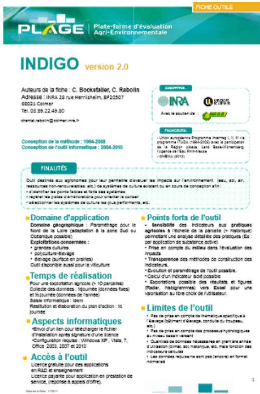
Figure 2 : Fiche descriptive type de chaque outil référencé sur plage-evaluation.fr (exemple d'INDIGO, INRA)