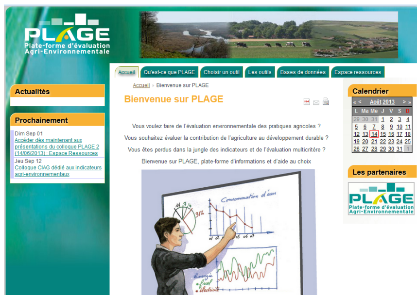
Figure 1 : plage-evaluation.fr , plate-forme d'information et d'aide au choix dédiée à l'évaluation de la durabilité des pratiques agricoles, des exploitations et des territoires

Ainsi, il paraissait impératif de favoriser l'adéquation entre les outils et le type d'usage en accompagnant d'une part l'utilisateur dans la formulation de ses besoins et en donnant d'autre part un maximum d'informations claires et pédagogiques permettant de comparer les outils et méthodes entre elles. Cet impératif a conduit à la réalisation d'un site internet disponible depuis janvier 2013 sur www.plage-evaluation.fr