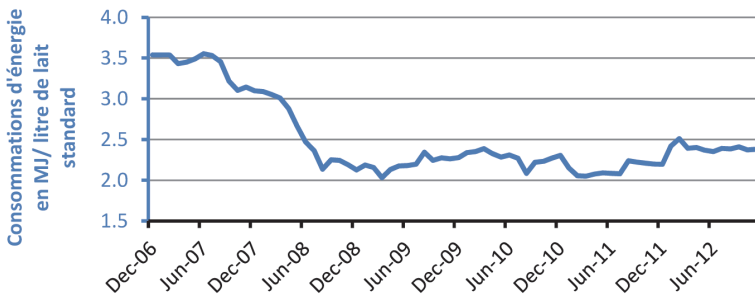
Figure 3. Consommations d'énergie fossile de l'atelier laitier à la ferme de Grignon (2006-2012) avec allocation économique entre lait et viande

Environ 90 % de la diminution des consommations d'énergie par litre de lait s'expliquent par l'alimentation des vaches. À titre d'illustration, la quantité de matière sèche d'aliments ingérés par litre de lait standard produit a diminué d'environ 13 % entre 2006 et 2011 grâce à l'augmentation de la productivité des animaux, et les consommations d'énergie fossile par unité de matière sèche d'aliments ingérés ont diminué d'environ 33 % sur la même période.