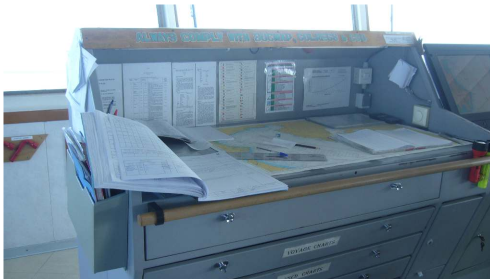
Figure 3. La table à cartes où se trouve le journal passerelle

d'anticipation en vue des prochains voyages. Si le navire est amené à refaire le voyage, il n'aura qu'à aller rechercher les informations dans son cahier personnel, beaucoup plus intelligible que les documents officiels.