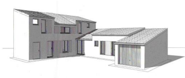
Figure 3. Modèle d'une maison de type Castille

Pour illustrer la démarche, nous présentons l'application de la méthode à l'une des maisons du quartier de Malartic. Dans un premier temps, le propriétaire doit renseigner des informations relatives à sa maison : type, surface habitable, année de construction, travaux déjà réalisés, etc. Cette maison de type Castille T5 (Figure 3), datant de 1975 et d'une surface habitable de 118m 2 avait une consommation initiale de 169 kWh/m 2 /an. Elle a fait l'objet de travaux de rénovation en 2010, et les fenêtres d'origine ont été remplacées par des fenêtres à double vitrage sur la façade Nord de la maison.