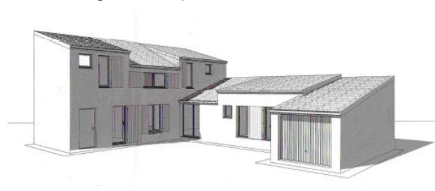
Figure 3. Modèle d'une maison de type Castille

Pour illustrer la démarche, nous présentons l'application de la méthode à l'une des maisons du quartier de Malartic. Dans un premier temps, le propriétaire doit renseigner des informations relatives à sa maison : type, surface habitable, année de construction, travaux déjà réalisés, etc. Cette maison de type Castille T5 (Figure 3), datant de 1975 et d'une surface habitable de 118m 2 avait une consommation initiale de 169 kWh/m 2 /an. Elle a fait l'objet de travaux de rénovation en 2010, et les fenêtres d'origine ont été remplacées par des fenêtres à double vitrage sur la façade Nord de la maison.