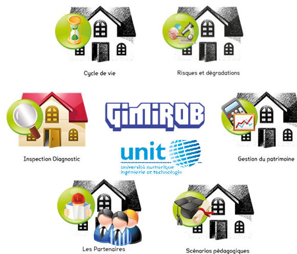
Figure 1. Page d'accueil du projet GIMIROB.

Le projet GIMIROB comporte quatre modules de formation de base (voir Figure 1) : "Inspection diagnostic", "Cycle de vie", "Risques et dégradations" et "Maintenance du patrimoine".