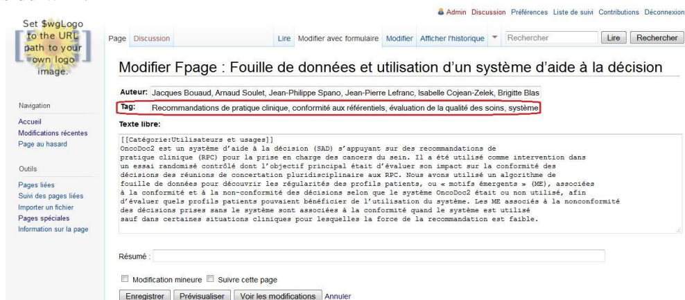
FIGURE 1 – Exemple de page tagguée.

par les utilisateurs autorisés à partager des connaissances sur le wiki. La plateforme propose à tous ses utilisateurs un champ (Figure 1) qui permet d’associer des tags (mots clés) à chaque page normale à la création. La quantité immense de tags stockés sur les pages cache plusieurs connaissances qu’il faut extraire pour réorganiser les liens entre les pages. Cela suppose alors une maintenance de cette plateforme par les experts du domaine. Cette maintenance consiste en l’annotation de nouvelles ressources, l’organisation des liens entre les ressources existantes. Pour guider l’expert dans cette maintenance, nous proposons dans ce papier une approche de découverte de nouvelles catégories utiles à partir des tags stockés sur les pages normales du wiki.