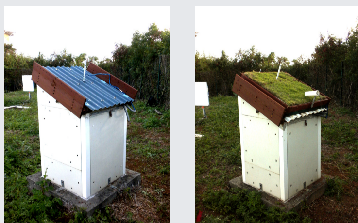
Fig.2 : Mise en œuvre des configurations.