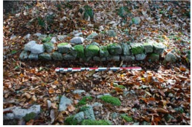
Saint-Goussaud, mur antique.

Pour ce qui est du thème des agglomérations « secondaires » gallo-romaines, si les découvertes ne