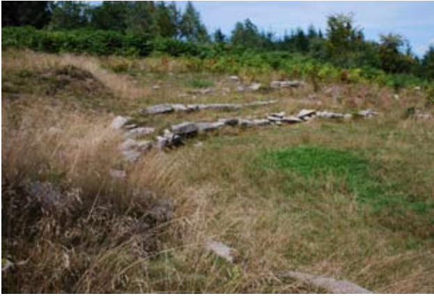
Saint-Goussaud, le théâtre.

Cette campagne de relevés a également été l'occasion de mettre au jour un nouveau bâtiment livrant notamment de la céramique sigillée (fragment de DRAG 37) et un bloc sculpté. De même, un deuxième bloc sculpté a pu être découvert lors de la reconnaissance dans la partie ouest du bois de Bridiers. Enfin, une demi-meule et une petite coulure de verre bleuté ont pu être mises au jour.