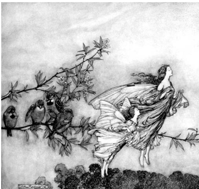
Fig. 4 : « Les fées ont leurs prises de bec avec les oiseaux »

Au XIX e siècle, les fées ont depuis longtemps déserté les campagnes anglaises. La révolution industrielle, particulièrement importante en Grande-Bretagne, amène plusieurs générations d’écrivains et d’artistes à considérer cet exil comme définitif, et, par réaction, à multiplier dans les arts et la littérature les hommages au petit peuple disparu de Titania et Obéron, dans le but de faire revenir les fées, de les faire revivre. James Matthew Barrie ne fait pas autre chose quand il décide de peupler son récit de créatures féeriques, qui, depuis la seconde moitié du XIX e siècle, font d’ailleurs partie intégrante, en Grande-Bretagne, des théma-