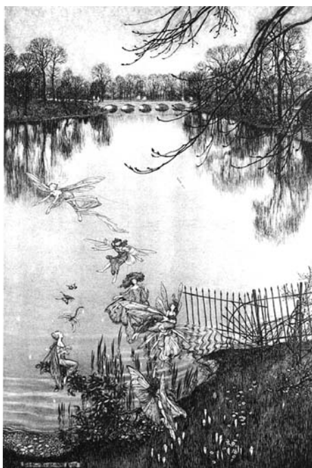
Fig. 2 : « C'est une rivière charmante, et il y a une forêt engloutie au fond... »