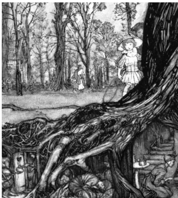
Fig. 5 : « Les fées se cachent toutes plus ou moins jusqu'au crépuscule... »

« Mon nouvel oncle m'emmena faire plusieurs visites passionnantes de Londres, mais les jours les plus extraordinaires étaient ceux où [il] m'autorisait à l'accompagner à une expédition de peinture. On parlait tôt par une matinée ensoleillée et mon oncle, chargé de tout son barda de peintures, pinceaux et chevalet, me rappelait l'un des gnomes décrits par Andrew Lang dans Blue Fairy Book ; mais une fois arrivés dans les jardins de Kensington, et