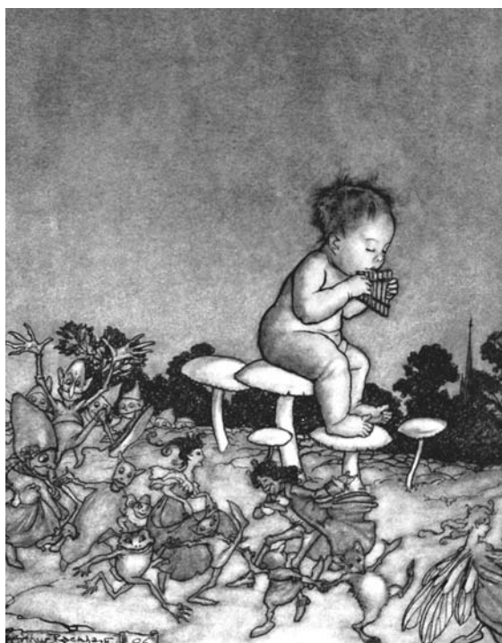
« Peter Pan est l'orchestre des fées... »