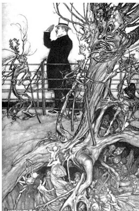
Fig. 1 : « Les jardins de Kensington sont à Londres, où habite le roi. »

Arthur Rackham se plaît beaucoup à suivre les métamorphoses géographiques que propose Barrie. Il passe de nombreuses après-midi à faire des croquis des jardins, des arbres et de ses différents lieux marquants, comme le lac Serpentine, qu'il peuple de créatures féeriques aux ailes de libellule. Rackham force donc le trait, aussi bien du point de vue du réalisme des paysages et des éléments d'architecture (ainsi que des personnes : on pense notamment à la composition qui comprend, en arrière-plan, un portrait du roi Edouard ; Fig. 1) que de celui de la merveille des créatures féeriques, qu'il ajoute souvent à un récit qui ne les décrit pas de manière aussi abondante. Par exemple, la vue représentant le lac Serpentine la nuit (Fig. 2), où abondent les fées au premier plan, correspond d'après la légende à un moment du texte où ces dernières sont absentes : « C'est une rivière charmante, et il y a une forêt engloutie au fond. Si on se penche par-dessus le bord, on peut voir les arbres grandir tout à l'envers, et on raconte que la nuit il y a aussi des étoiles englouties à l'intérieur 6 . »