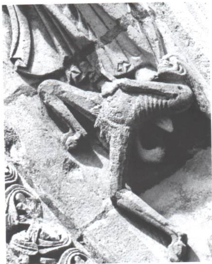
Fig.6 : Vice écrasé par la vertu, XII e siècle. Civray, Saint-Nicolas.

s'en trouvent complètement désarticulés (Fig.6). Ce traitement dévalorisant de la souffrance corporelle est renforcé par une physionomie particulièrement repoussante qui rend compte de la « nature » foncièrement mauvaise des personnifications. Par exemple, à Aulnay-de-Saintonge, le vice prend la forme d'un corps émacié au ventre bombé et ceint d'une couronne de longs poils tandis que la tête présente un visage boursofflé, ridé et grimaçant.