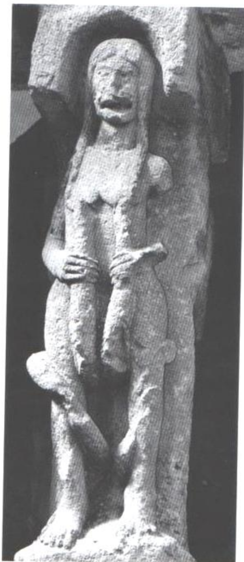
Fig.1 : Femme luxurieuse attaquée par des serpents, XII e siècle. Montmorillon, Octogone.

Champagnolles et Saint-Blaise de Givrezac en Saintonge, où les modillons montrent des figures obscènes aux organes génitaux disproportionnés.