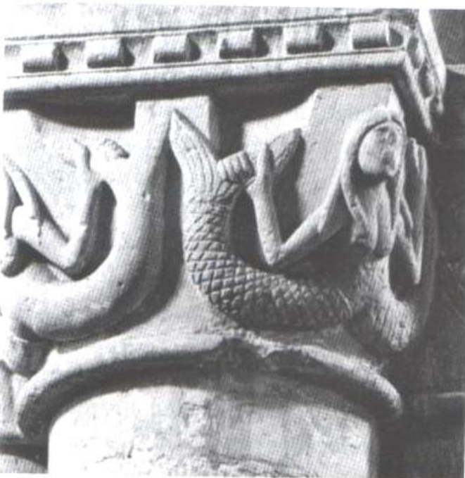
Fig.2 : Sirènes, XII e siècle. Saint-Maixent.

souvent figuré sous la forme d'un corps féminin intégralement nu abominablement attaqué par des reptiles, comme dans l'ébrasement gauche du portail méridional de l'abbatiale Saint-Pierre de Moissac sculpté vers 1115 où une femme luxurieuse se fait mordre le pubis par un gros crapaud et les seins par des serpents qui rampent le long de ses jambes. Cette femme s'avère d'autant plus répugnante que son corps, encore vivant, est affecté par les symptômes d'une décomposition avancée : son visage comme ses jambes sont décharnés, sa poitrine osseuse, ses seins pendants et son ventre bombé. Elle est par ailleurs accompagnée d'un horrible démon au ventre proéminent qui se moque d'elle. Cette iconographie fortement dévalorisante apparaît dans bien d'autres édifices, comme à l'Octogone de Montmorillon où une femme au visage hideux, sculptée au XII e siècle, se fait mordre les seins par deux longs serpents qui se glissent symétriquement entre ses cuisses (Fig.1). La condamnation de la luxure s'insinue même parfois dans les éléments architecturaux secondaires, comme dans les églises Saint-Pierre de