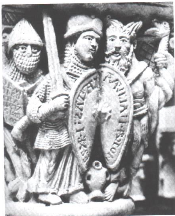
Fig.7 : Charité luttant contre Avarice, vers 1100. Clermont, Notre-Dame-du-Port.

néralité absolue des vertus. De fait, dans le poème de Prudence, rares sont les blessures infligées par les vices aux guerrières de l'armée du Christ. Même si elles sont constituées de chair, de sang et d'os, les personnifications restent pratiquement inviolables, comme le prouve la Concorde qui n'est que légèrement blessée par l'attaque de la Discorde qui la poignarde pourtant en traître avec une dague dissimulée sous son vêtement : « Mais il ne fut pas possible de percer les organes vitaux du corps sacré ; l'épiderme ne fut blessé que