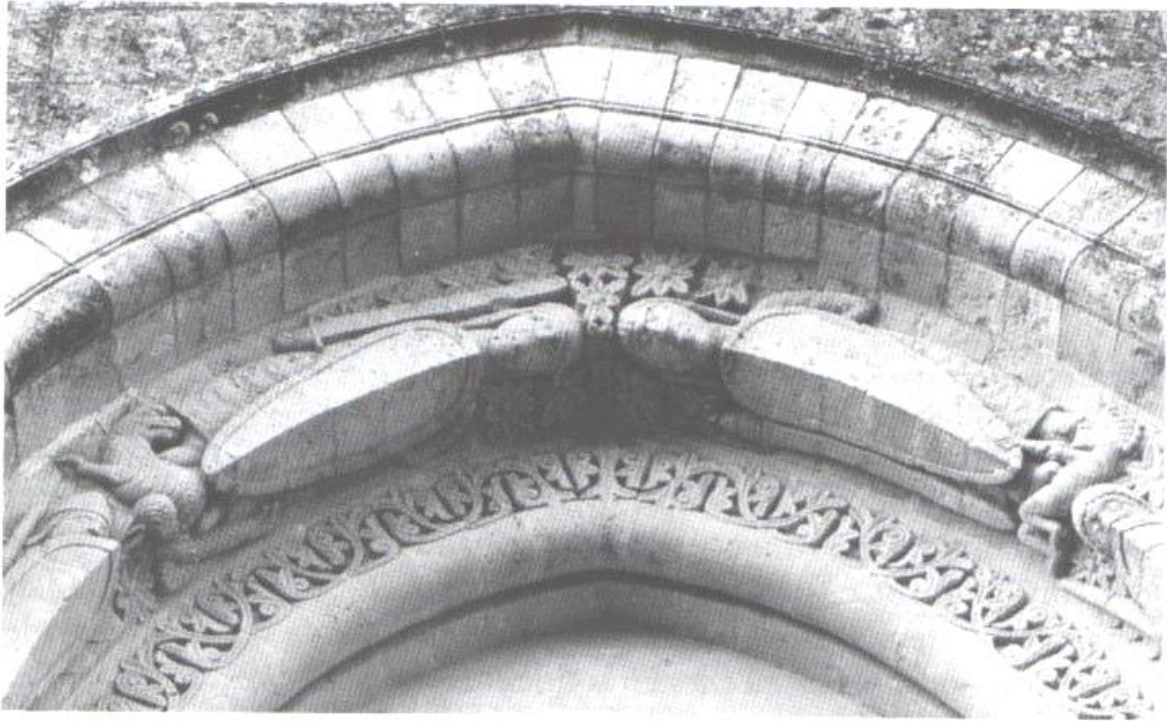
Fig.10 : Psychomachie , vers 1120-1160. Aulnay-de-Saintonge, Saint-Pierre, façade sud.