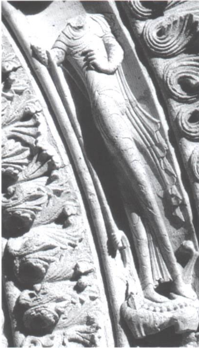
Fig.9 : Vertu, XIIe siècle. Blasimon, Saint-Nicolas.

Nicolas de Blasimon (Fig.9). Celle-ci porte une longue robe s'arrêtant aux chevilles qui épouse la forme de son corps et qui souligne l'élégance de sa position. Ses jambes, graciles et élancées, se croisent, donnant à la figure une attitude dansante amplifiée par la gracieuse rotation du bassin et des épaules tandis que sa main gauche, qui se lève au niveau de sa poitrine, exécute un geste maniéré. Ses articulations anatomiques sont par ailleurs beaucoup moins marquées que chez les vices. Enfin, les plis de sa robe qui adhère à son ventre et à sa poitrine dessinent de longues courbes parallèles régulières et calmes. Seule sa main droite qui abat une lance sur le vice indique que la personnification est en train de combattre.