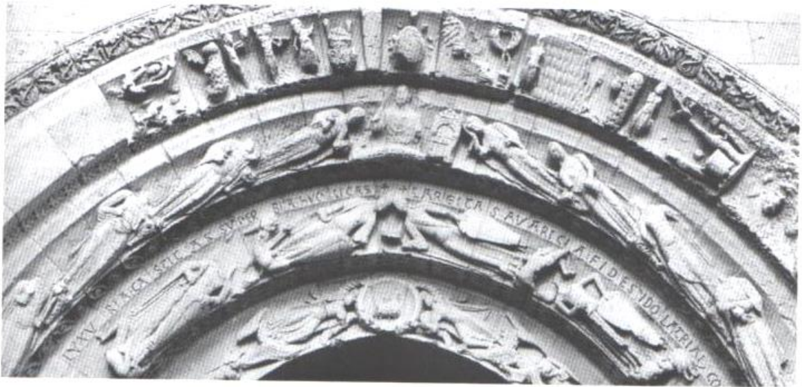
Fig.3 : Psychomachie , vers 1120-1160. Aulnay-de-Saintonge, Saint-Pierre, portail occidental.

Le poème de Prudence rencontre un succès considérable au Moyen Âge, notamment à l'époque romane où il devient une source d'inspiration incontournable des moralistes qui le reprennent et le développent considérablement, comme Bernard de Clairvaux ou Alain de Lille dans le De pugna spirituali et l' Anticlaudianus 13 . Dans les arts visuels, il s'impose également comme une œuvre de référence, d'abord dans les manuscrits où il est copié à de nombreuses reprises – une vingtaine d'exemplaires réalisés entre le IX e et le XIII e siècle sont conservés –, puis dans les programmes sculptés qui se développent aux entrées des églises au XII e siècle 14 . Il prend alors la forme d'une série de personnifications disposée dans les voussures des portails montrant les vertus debout sur les vices, comme dans le portail occidental de l'église Saint-Pierre à Aulnay-de-Saintonge (Fig.3). La série s'inscrit ici dans la troisième voussure et compte six couples de vertus et de vices identifiés par des inscriptions : Humilité, Largesse, Chasteté, Foi, Concorde et Patience écrasent Orgueil, Avarice, Colère, Luxure, Idolâtrie et Discorde.