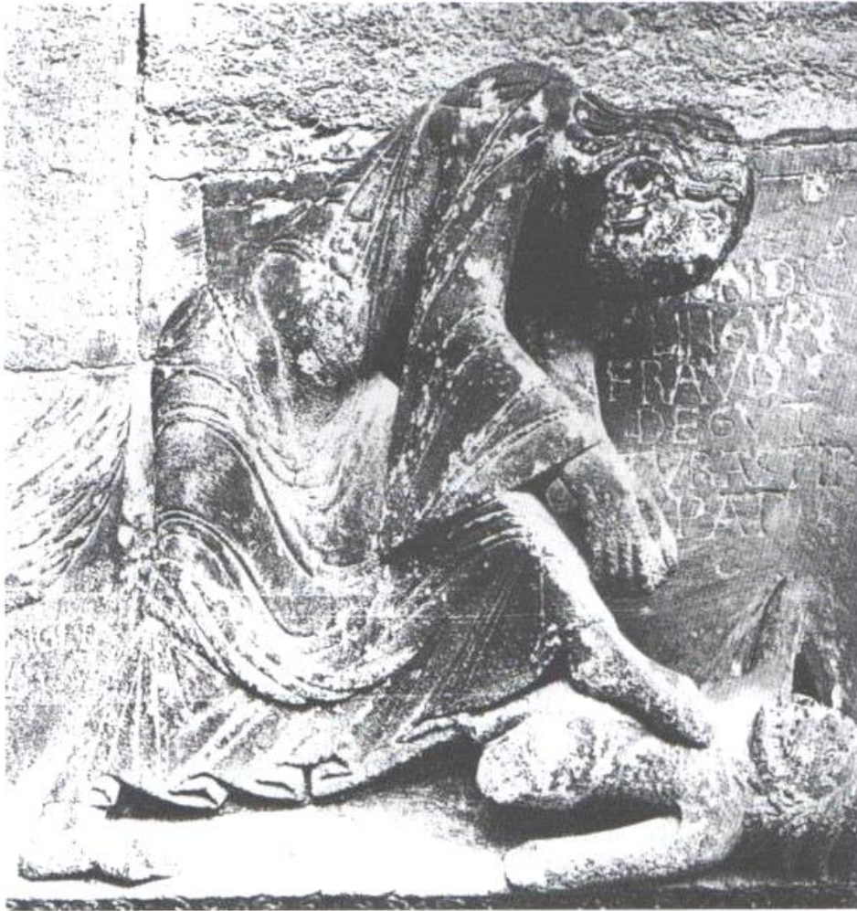
Fig.5 : Attribuée à Guglielmo da Modena, Vérité arrachant la langue de la Fraude , XIIe siècle. Crémone, cathédrale.

datant également du XII e siècle, conservé aux Musei civici del castello visconteo et provenant de l'église Santa Maria Maggiore, la Foi, après avoir triomphé de la Discorde, va jusqu'à démembrer méticuleusement le corps de son adversaire pour l'offrir en repas à un loup et un corbeau 20 . Dans un manuscrit datant du IX e siècle et conservé à la Bibliothèque nationale de France (ms. lat. 8085, fol. 61), c'est l'armée de l'Humilité qui, après avoir déshabillé l'Orgueil tombé de cheval à cause d'un piège tendu par la Ruse, lui tranche la tête sans aucune pitié. Enfin, sur la façade sud de la cathédrale de Crémone, dans un relief attribué à Guglielmo da Modena, la Vérité plaque violemment avec son pied la Fraude contre le sol afin de lui arracher la langue de la bouche, comme l'indique le titulus 21 (Fig.5).