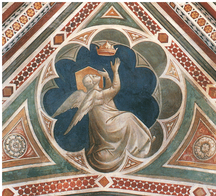
Fig. 4 - Taddeo Gaddi, Espérance , 1331-1338, Florence, Santa Croce, chapelle Baroncelli.

La vocation architecturale des vertus transparait également dans la littérature de l'époque. Ainsi, chez Dante (1265-1321), la paroi de la montagne du Purgatoire est ornée, entre le premier et le deuxième cercle, de trois bas-reliefs en marbre illustrant des exempla de l'Humilité 14 . À Florence, ce rôle fondateur se manifeste clairement dans le décor sculpté du Campanile de Santa Maria del Fiore, commencé par Giotto à partir de 1334 : les reliefs des vertus, sculptés vers 1351-1359 sous la direction de Francesco Talenti (v. 1300-1369), prennent place aux étages inférieurs, où elles sont environnées d'un décor constitué de dalles de marbre réelles (fig. 5). Comparable à celui de la chapelle de l'Arena, ce soubassement rend explicite la valeur dont la peinture en grisaille est investie au Trecento. Loin de se réduire à un simple artifice pictural, l'imitation de la sculpture contribue à rendre compte des propriétés des personnifications et des valeurs morales : d'un côté, elle résout le problème de la figuration de l'infigurable ; de l'autre, elle signifie la permanence des vertus et affirme leur présence au sein de l'édifice ecclésiastique.