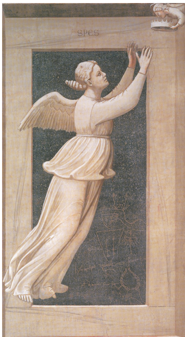
Fig. 2 - Giotto di Bondone, Esperance , 1303-1305, Padoue, chapelle de l'Arena.