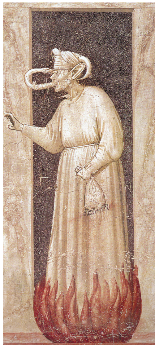
Fig. 3 - Giotto di Bondone, Envie , 1303-1305, Padoue, chapelle de l'Arena.

En s'associant au marbre, les personnifications acquièrent un peu de ses qualités : elles deviennent permanentes. Leur fonction mémorielle en vient ainsi à se confondre avec leur statut ontologique. En effet, pour les théologiens de la fin du Moyen Âge, les vertus sont des « Êtres » et des puissances