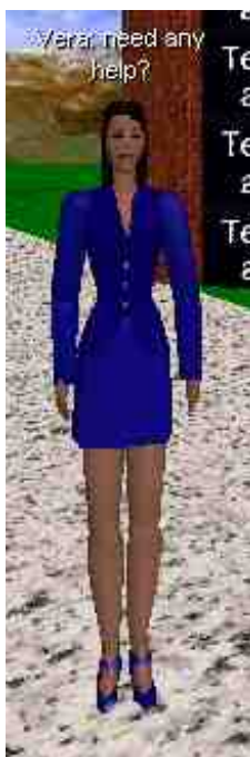
Un avatar dans un monde virtuel, en train de proposer de laide (voir le texte au-dessus)

Ces développements fournissent aussi le moyen de réintroduire dans le Web le grand absent dont nous parlions plus haut, ce médiateur présent dans toute bibliothèque réelle : le bibliothécaire.