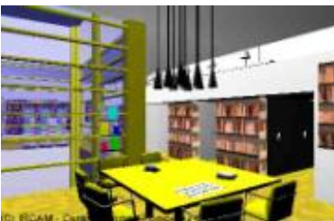
Interface de réalité virtuelle de la Médiathèque de Ilrcam

À l'inverse, limage peut aider à la localisation d'un document dont on a trouvé la fiche : dans le catalogue de la Médiathèque de Ilrcam 6 , un plan attaché à chaque notice d'ouvrage indique la zone précise dans laquelle se trouve le document, s'il est disponible. Le lecteur peut ainsi s'abstenir de relever la cote précise, et retrouver la monographie souhaitée plus rapidement.