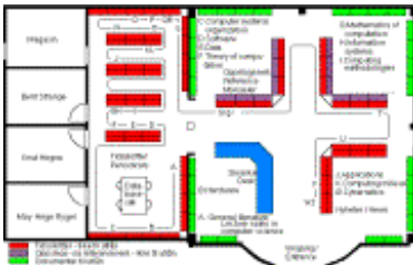
Plan de la bibliothèque de l'université d'Oslo

De nouvelles interfaces prennent dorénavant en compte les autres capacités de l'ordinateur et des postes de consultation : graphiques planes ou tri-dimensionnelles, fixes ou variables dans le temps et sonores (casque, enceintes).