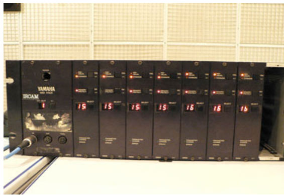
Figure 1. A l'Ircam, un synthétiseur d'origine Yamaha TX 816, dont une grande partie des modules ne fonctionne plus.

Cette différence d'approche n'est pas uniquement technique. Elle correspond fondamentalement à une différence ontologique : alors que l' harmonizer et la réverbération, entrant en jeu dans le traitement temps réel de l'alto solo, opèrent selon des catégories musicales (d'une part la reprise transposée d'une idée musicale ; d'autre part, un type de conduite du son dans le temps), la synthèse de sons selon les techniques FM est perçue comme une technique particulière, presque contingente à une époque, à la « couleur » sonore des années 1980. Qu'ils opèrent ou non selon des catégories musicales, comment toutefois positionner ces modules dans une classification ?