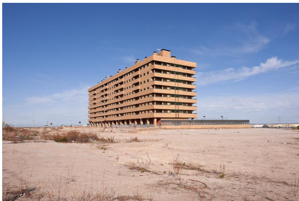
Photographie n° 3 Gabri Solera