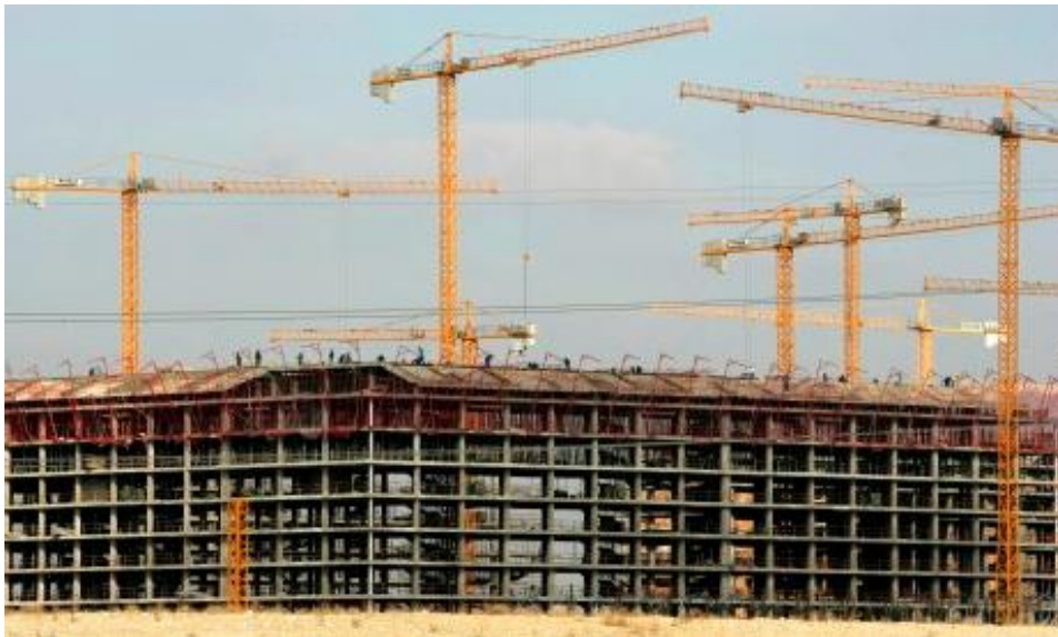
Photographie n° 1

Reportage Solera Gabri "Empty buildings haunt Spain" The Associated Press, 16/02/2012.