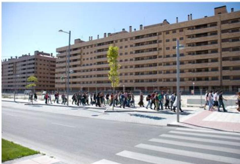
Photographie n° 2 Visite organisée par le Groupe Mmmm en octobre 2008