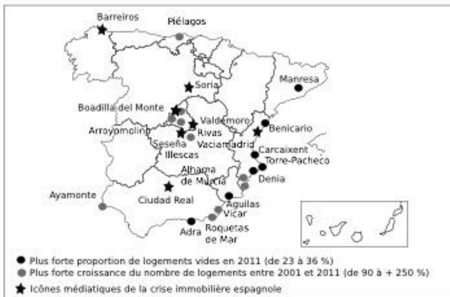
Figure 2 : Des cités inachevées aux "villes fantôme" : croissance du bâti, taux de vacance et couverture médiatique des scandales immobiliers