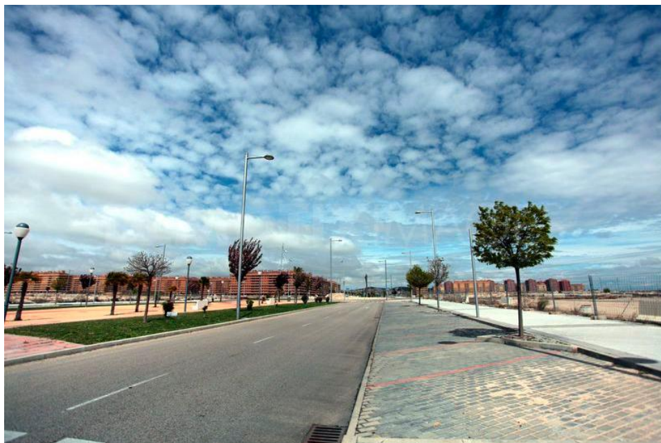
Photographie n° 4 Nathalie Paco