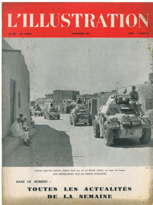
Figure 7 : couverture de la revue L'Illustration de 7 novembre 1942 sur l'entrée des forces italiennes dans l'oasis de Siwa.

Carrefours de nombreux échanges, commerciaux ou non, certes, mais les oasis méritent-elles ce rôle « d'agents à part entière » spécifiquement de l'échange commercial saharien ? Plus qu'on ne le pense habituellement, car au-delà du cliché du Bédouin gouvernant sa caravane en son royaume désertique, il faut réattribuer aux sédentaires l'initiative et l'organisation de leur propre commerce, malgré — peut-être en contredisant un autre cliché — leur normale méconnaissance du désert.