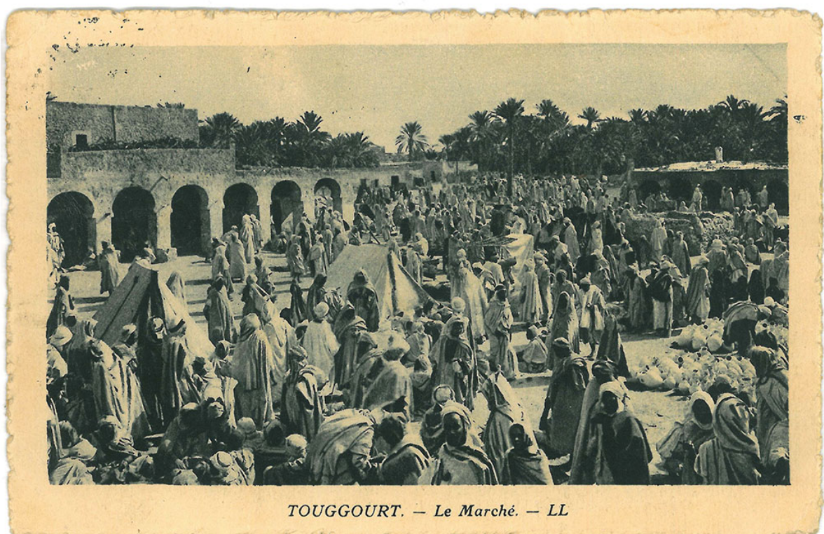
Figure 4 : Carte postale (non datée, Algérie) : « Touggourt, Le marché (L.L.) » (Éditeur Lévy & Neurdein réunis, Paris)

ces routes sahariennes 28 . En fait, la rupture de charge dans les oasis devait probablement bien plus être la règle que l'exception : les marchands n'achetaient pas les dromadaires aux éleveurs, mais les leur louaient, avec certains de leurs services (en particulier de protection) et les caravanes elles-mêmes, du moins les plus grandes, n'étaient la propriété de personne mais d'associations temporaires de plusieurs marchands, qui se reformaient dans ces oasis relais (Figure 4). Les dromadaires qui transportaient les biens du Nord d'un marchand dans un sens étaient peu vraisemblablement ceux utilisés pour exporter les biens du Sud dans l'autre sens, car le voyage retour impliquait la création de nouvelles caravanes, de tailles différentes, impliquant de nouvelles personnes. Par ailleurs, selon Andrew Wilson, ce n'étaient pas les mêmes races de dromadaires qui étaient utilisées pour les parties nord et sud du Sahara. C'est justement la nature fragmentée du commerce caravanier qui rend difficile pour les historiens d'en trouver des registres satisfaisants 29 et les a conduit à mésestimer l'envergure de ces échanges dès l'époque romaine 30 .