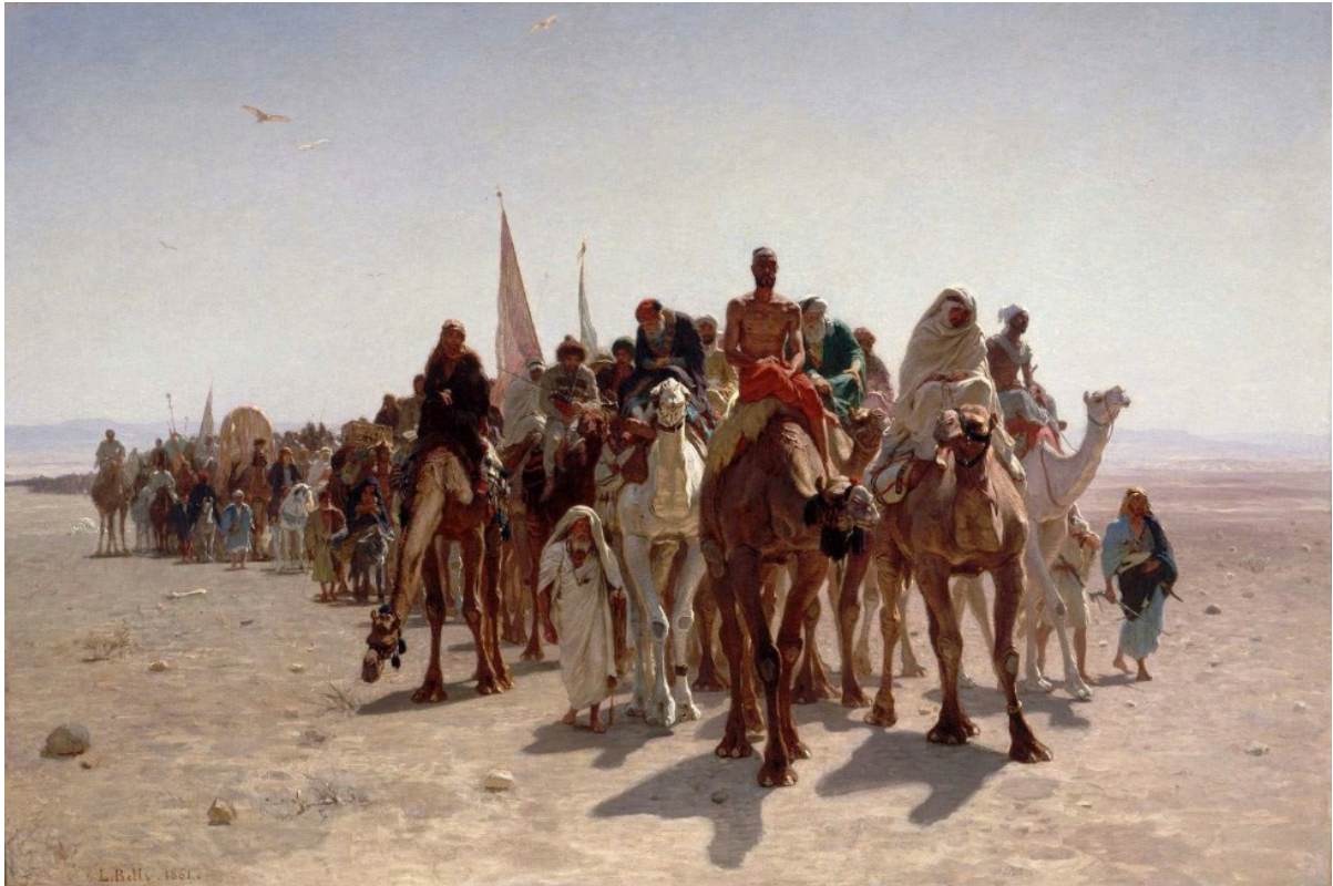
Figure 5 : Un « chef d'œuvre » de la peinture orientaliste : Pèlerins allant à La Mecque de Léon Belly (1861), conservé au Musée d'Orsay (Paris).

Selon Bisson, les premiers officiers européens partis en reconnaissance qui visitèrent ces villes oasis, aussi bien que les détachements militaires qui les occupèrent, tous furent étonnés de leur déclin. On avait oublié que l'une des raisons majeures était que la conquête en avait écarté les commerçants. La palmeraie aurait ainsi été, indûment, privilégiée et l'on crut que les oasis vivaient exclusivement de leurs jardins. Bisson souligne le contresens, l'agriculture n'aurait été destinée qu'à assurer la subsistance de propriétaires riches d'une activité autre qu'agricole : l'activité commerciale.