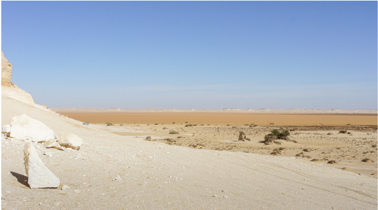
Figure 10 : Oasis antique abandonnée : al-εAraj, désert Libyque, le 22 novembre 2010