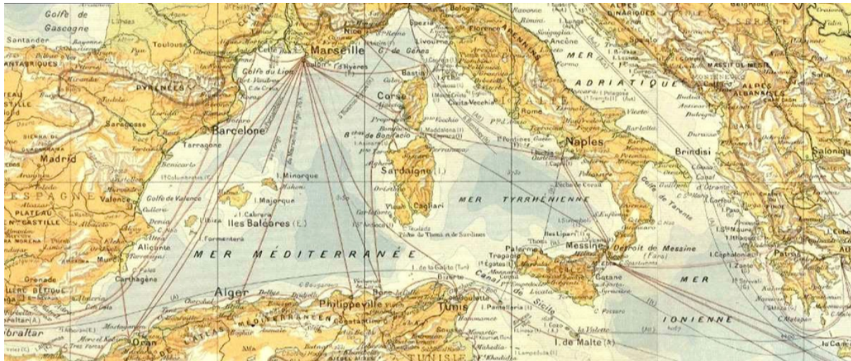
Figure 1 : Une carte de la partie ouest du bassin méditerranéen avec ses routes maritimes vers 1910.

période prémoderne 20 , eu égard non pas au réseau lui-même, mais à sa dépendance à une espèce unique (le dromadaire) et aux conditions géographiques très variables du Sahara (tandis que la mer Méditerranée est pour lui plus uniforme et la dépendance aux bateaux différente de par leur nature d'artefacts).