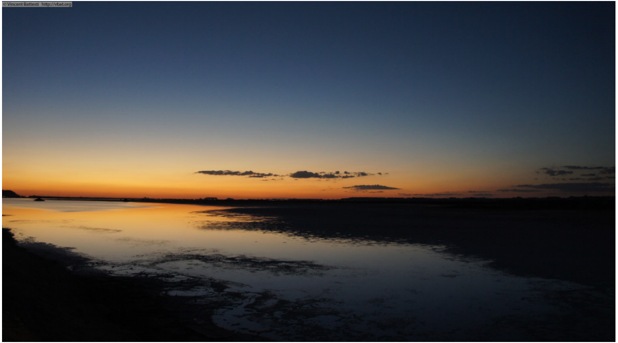
Figure 11 : Oasis insulaire. Siwa, Égypte. 31 octobre 2010