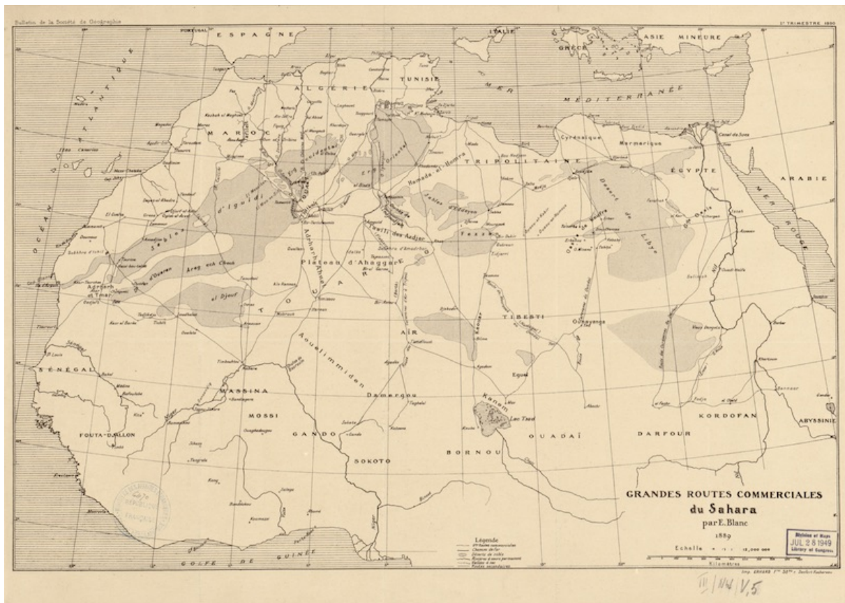
Figure 6 : Grandes routes commerciales du Sahara in É. Blanc (1890)

« On voit, par cette nomenclature incomplète, que ces îles, ces archipels au milieu d'un océan de sables et de désert, possèdent toutes les ressources que peuvent donner la terre et le commerce exploités par des populations sur lesquelles n'a pas encore lui un seul des rayons de la civilisation moderne. Beaucoup de soleil, beaucoup d'eau, beaucoup de bras et une terre féconde peuvent y rendre abondants les produits de toute espèce; une position unique au monde, l'étape obligée du commerce d'une très-grande partie d'un des plus vastes continents, lui assure ceux que lui refusera son sol. Qu'une race industrielle et forte s'établisse là un jour, elle peut y créer une belle colonie, un entrepôt colossal, et relier le monde des anciens à un monde encore ignoré. » (de Colomb, 1860 : 41-42)