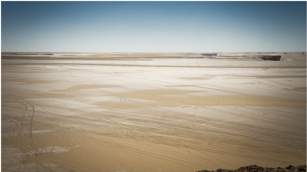
Figure 9 : Sur la route de l'ancienne oasis de Bahrein, désert Libyque, le 22 novembre 2010

mais aussi depuis les États haoussa au sud du Sahara — en passant par Murzuq et Awjila (Greenberg, 1946 : 4). Quelle est son antiquité, on l'ignore.