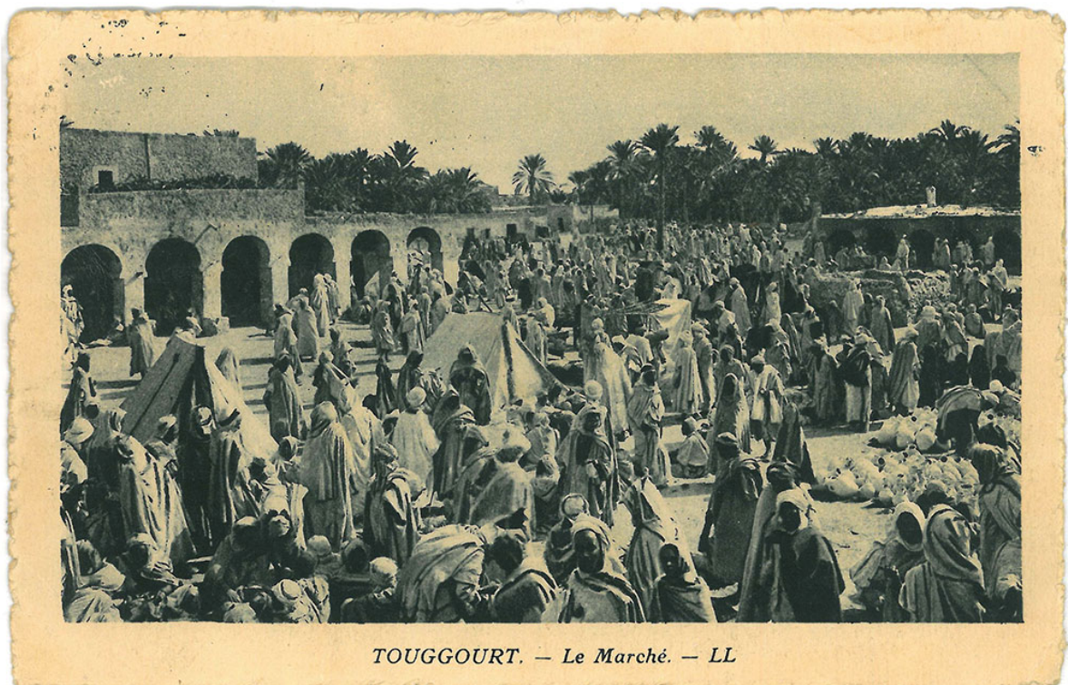
TOUGGOURT. — Le Marché. — LL