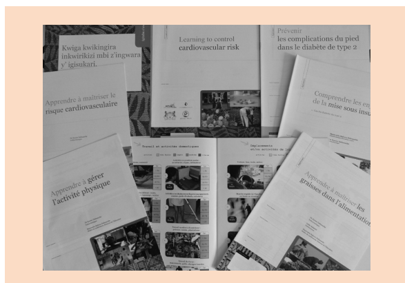
Illustration 1 : Les livrets de la collection Education et prévention des maladies chroniques

les grignotages). Après avoir identifié les bénéfices de chaque action, l'apprenant en choisit une ou plusieurs, en réfléchissant à la pertinence, à la faisabilité et à l'attractivité de chacune d'elles. Invitée à tenir compte de ses dispositions personnelles spécifiques et du contexte social et économique qui est le sien, la personne malade chronique peut alors s'engager à mener ou non l'action qu'elle a choisie.