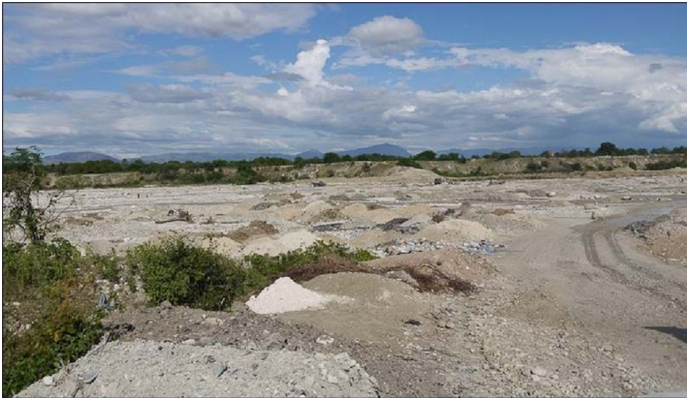
Illustration 5 - Décharge sauvage de déchets de la construction en bord de la Rivière Grise, Tabarre