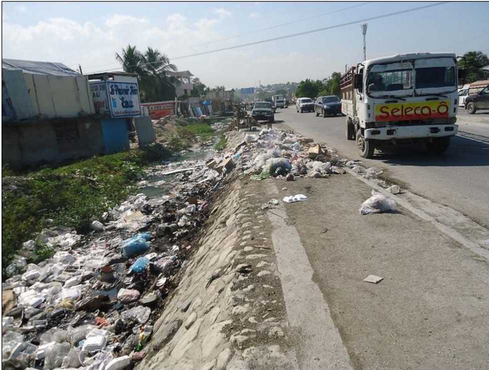
Illustration 4 – Dépôt sauvage des déchets ménagers en bord de route à Tabarre