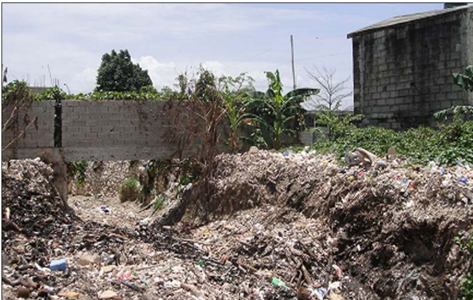
Illustration 1 - Encombrement des ravines de Tabarre par des déchets