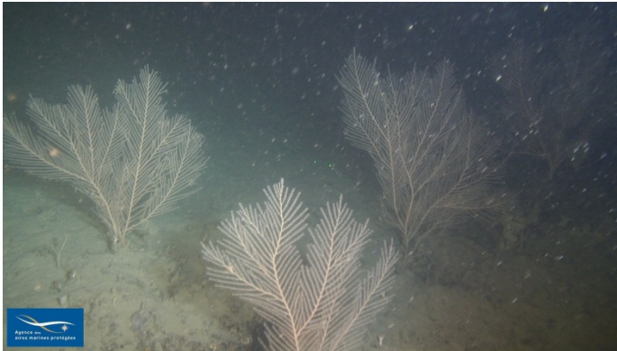
Figure 7 Faciès à Callogorgia verticillata

Le faciès à Callogorgia verticillata a également été observé (figure 7). Il est peu fréquent. Ce faciès (V.3.1.c.) est listé dans la typologie actuelle (2011) au sein de la biocénose des roches bathyales (V.3.1.).