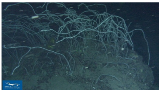
Figure 6 Faciès à Viminella flagellum

Viminella flagellum a été fréquemment observée sur les fonds durs de la zone prospectée (figure 6). Elle forme des faciès localisés avec des densités élevées. Dans la typologie actuelle (2011), ce faciès de la biocénose des roches bathyales (V.3.1.) est identifié (V.3.1.b.).