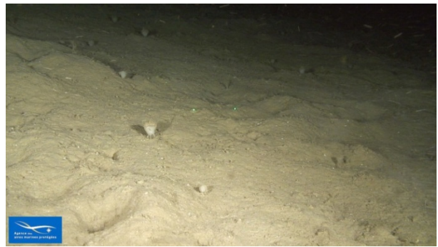
Figure 3 Faciès à Thenea muricata

Ce faciès de la biocénose des vases bathyales (V.1.1.) a également été observé (figure 3), en majorité dans le haut de l'étage bathyal. Il est référencé dans la typologie actuelle (2011) en tant que faciès des vases sableuses à Thenea muricata (V.1.1.a.). Les observations faites lors de