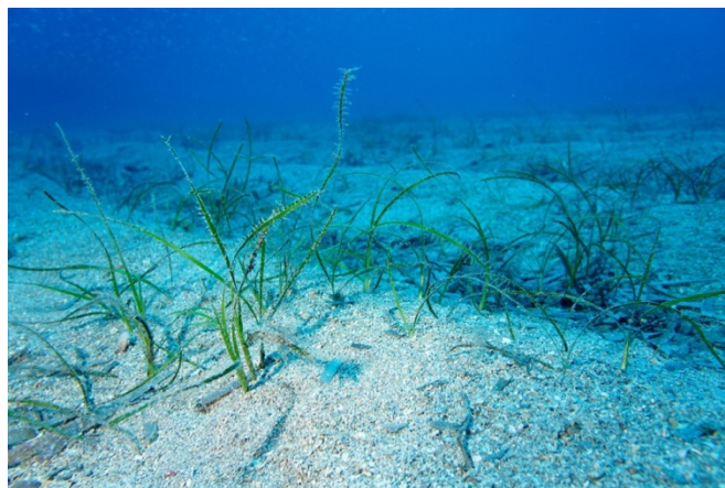
Figure 11 Cymodocea nodosa sur des sédiments détritiques

Dans les rapports des sites FR9301995 - Cap Martin (ANDROMEDE OCEANOLOGIE, 2011), FR9402017 - Golfe d'Ajaccio (ANDROMEDE OCEANOLOGIE et STARESO, 2012) et FR9402014 - Grand herbier de la côte orientale (Vela et al. , 2012), des petites taches de Cymodocea nodosa ont été observées sur des sédiments détritiques parfois en dessous de la limite inférieure d'un herbier de posidonie. Pergent (comm. pers., mars 2014) confirme qu'il est fréquent en Corse de rencontrer des cymodocées au-delà de la limite inférieure de l'herbier de posidonie et sur un substrat proche du détritique côtier (figure 11). L'ajout d'une association à Cymodocea nodosa au sein de la biocénose du détritique côtier (DC) (IV.2.2. dans la typologie actuelle (2011)), biocénose du circalittoral, serait en contradiction avec la définition de la limite entre les étages infralittoral et circalittoral (= limite de vie des phanérogames marines). Pergent et Verlaque (comm. pers., mars 2014) sont donc d'avis d'inclure cette association au sein de la biocénose des sables et graviers sous influence des courants de fond (SGCF) (III.3.2. et IV.2.4. dans la typologie actuelle (2011)). Bellan et Bellan-Santini (comm. pers., juin 2014) trouvent plus judicieux d'attendre une étude de la composition spécifique pour déterminer la biocénose présente. Il est donc décidé de ne pas modifier la typologie actuelle (2011) et de veiller aux futures recherches qui pourraient apporter ces informations complémentaires.