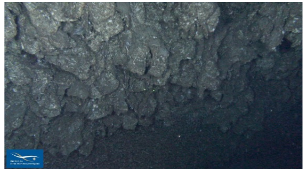
Figure 8 Faciès de Neopycnodonte zibrowii

De nombreuses observations de ce faciès à Neopycnodonte zibrowii ont été faites durant les deux campagnes sur les fonds rocheux (figure 8). La quasi totalité de ces observations correspondait à des thanatocénoses d’huitres fixées et seulement 1 à 2 individus ont été vus vivants. Ce faciès (V.3.1.a.) de la biocénose des roches bathyales (V.3.1.) est référencé dans la typologie actuelle (2011).