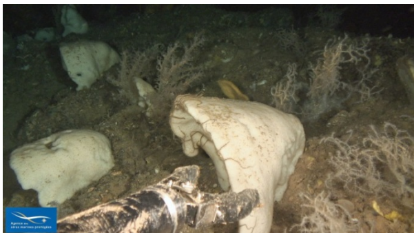
Figure 10 Faciès des grandes éponges

MEDSEACAN et CORSECAN ne semblent pas confirmer l'existence d'une biocénose distincte pour les coraux. Cependant, la liste des espèces associées à ces différentes observations permettrait de lever ces doutes. Pour les massifs de Lophelia pertusa sur fonds vaseux, deux cas sont possibles :