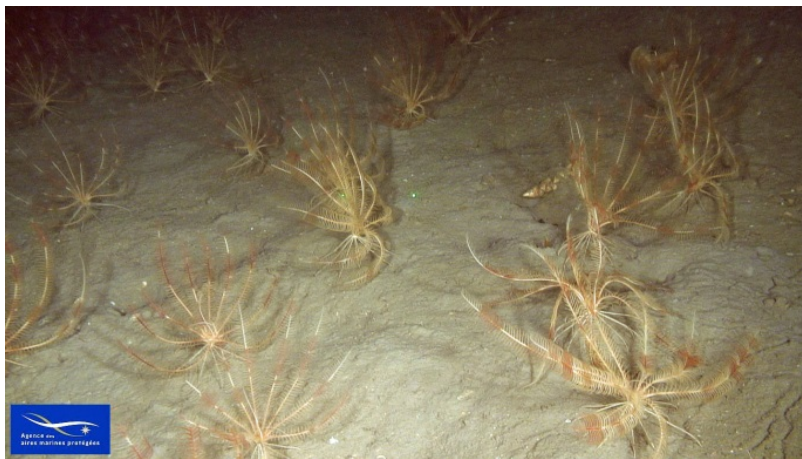
Figure 2 Faciès à Leptometra phalangium

Les informations apportées par les campagnes MEDSEACAN et CORSEACAN ne sont pas suffisantes pour déterminer si les observations faites de ce faciès se rapportent à cette biocénose (DL) ou à une autre biocénose. Au vu des densités élevées de Leptometra phalangium , il est décidé d'ajouter ce faciès à la typologie actuelle dans le bathyal au sein de la biocénose des vases bathyales . Cependant, une étude spécifique serait nécessaire afin de déterminer la biocénose de rattachement de ce faciès et de lever le doute sur l'existence d'une nouvelle biocénose de l'étage bathyal. Les experts italiens sont en désaccord avec cet ajout. Ils considèrent que ce faciès est caractéristique du bord du plateau continental dans des zones de transition entre le bas du circalittoral et le haut du bathyal et proposent de modifier le libellé du faciès référencé dans le circalittoral pour indiquer cette spécificité sans l'ajouter dans le bathyal. Au sein de la classification espagnole (Templado et al. , 2012), Leptometra phalangium est référencée dans le bathyal à la fois sur fonds rocheux, sur fonds détritiques et sur les fonds meubles du bord du plateau continental. La réhophilie de cette espèce pourrait expliquer cette apparente indépendance vis-à-vis de l'étagement et du substrat. De futures recherches apportant des informations complémentaires sur sa répartition permettront de confirmer ou non le choix fait ici pour la mise à jour de la typologie.