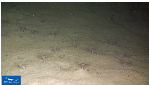
Figure 4 Champs de cérianthaires

De fortes densités de cérianthaires, probablement de l'espèce Arachnanthus oligopodus , ont été observées sur des fonds vaseux à sablo-vaseux (figure 4). Cependant, les informations récoltées ne sont pas assez précises pour pouvoir justifier de la création