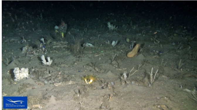
Figure 5 Débris de coraux avec des individus vivants de Dendrophyllia cornigera

Des zones de débris de coraux profonds comportant des individus vivants de Dendrophyllia cornigera ont été observées sur des fonds sableux (figure 5). Dans la typologie actuelle (2011), il n'existe qu'une seule biocénose des fonds détritiques : la biocénose des sables détritiques bathyaux à Gryphus vitreus (SDB)