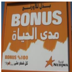
Figure 2 - Affiche publicitaire

Ce qui est accrocheur à première vue, c'est le fait que les annonces publicitaires de la téléphonie mobile ainsi que celles des produits alimentaires battent le record en matière d'alternance codique.