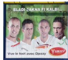
Figure 5 - Affiche publicitaire

La figure 4 ci-dessus montre clairement un bigraphisme accrocheur, en gros caractères et en position haute. En effet, il s'agit du mot « Chiche » qui dans son acception générale désigne un adjectif qualifiant une personne avare et cupide, en revanche, dans cette enseigne publicitaire, son usage fait référence au fait d'être capable de céder sa place dans un taxi à des personnes inconnues. Coca Cola cherche, via ce genre d'affichage, à améliorer son image de marque en incitant les Algériens consommateurs de sa boisson à faire de bonnes actions. Le fait que le mot « chiche » soit mis en exergue n'est pas arbitraire : il s'agit à la