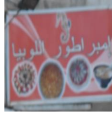
Figure 7 – Enseigne commerciale Alger