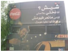
Figure 4 - Affichage transport

Cette méthode de transcription croisant deux systèmes linguistiques différents (L1) et (L2) est de plus en plus utilisée dans les publicités quelle que soit leur nature. Qu'il s'agisse de produits alimentaires, de soutien à l'équipe nationale de football, ou de téléphonie mobile, les concepteurs usent et abusent à leur guise du bigraphisme (arabe algérien / français) 4 ou (français/ arabe algérien) 5 .