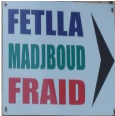
Figure 8 – Enseigne commerciale Tlemcen