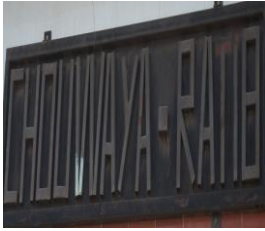
Figure 6 – Enseigne commerciale Tlemcen