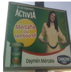
Figure 3 - Affiche publicitaire

La première affiche en partant de gauche, appartenant à l'opérateur téléphonique Nedjma 2 illustre parfaitement ce que nous avons avancé plus haut. Le français, l'arabe classique, et l'arabe algérien y font figure, et ce, dans un même énoncé, c'est donc une alternance codique endogène, puisque le trilinguisme en question caractérise un seul et même énoncé.